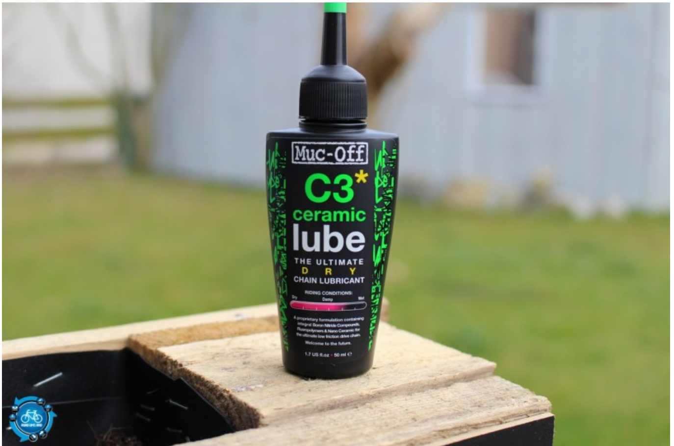
Muc Off C3 ceramic lube