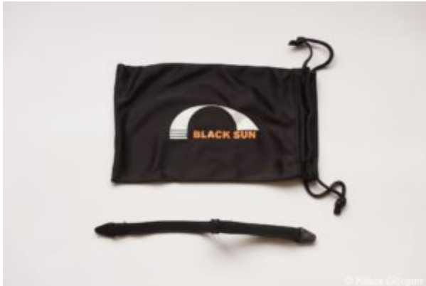
Eagle Five Microfaserbeutel, Kopfband