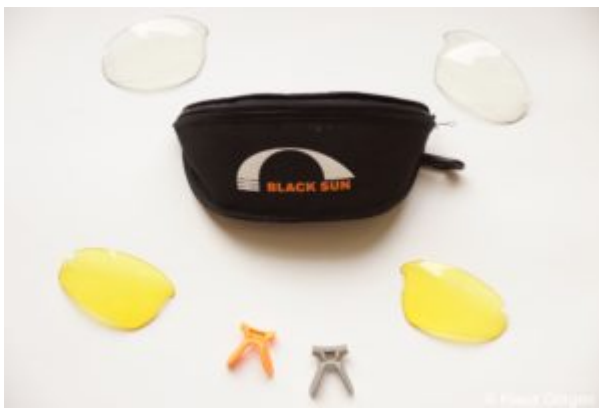
Eagle Five Zubehör