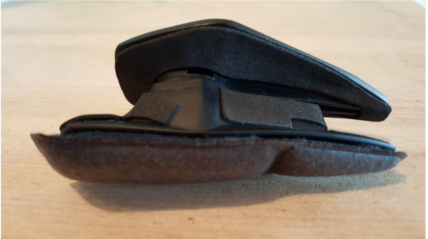
Plugin für Kamera- / Lampenhalterung