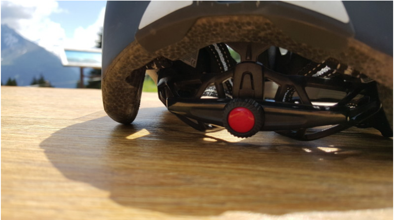
Drehverschluss - einhändig bedienbar und fein gerastert

Das Gurtsystem wird mittels Clip-System in der Länge variiert. Alle Einstellungen sind sehr leicht durchzuführen und völlig ausreichend, um den Helm auf die individuellen Bedürfnisse anzupassen