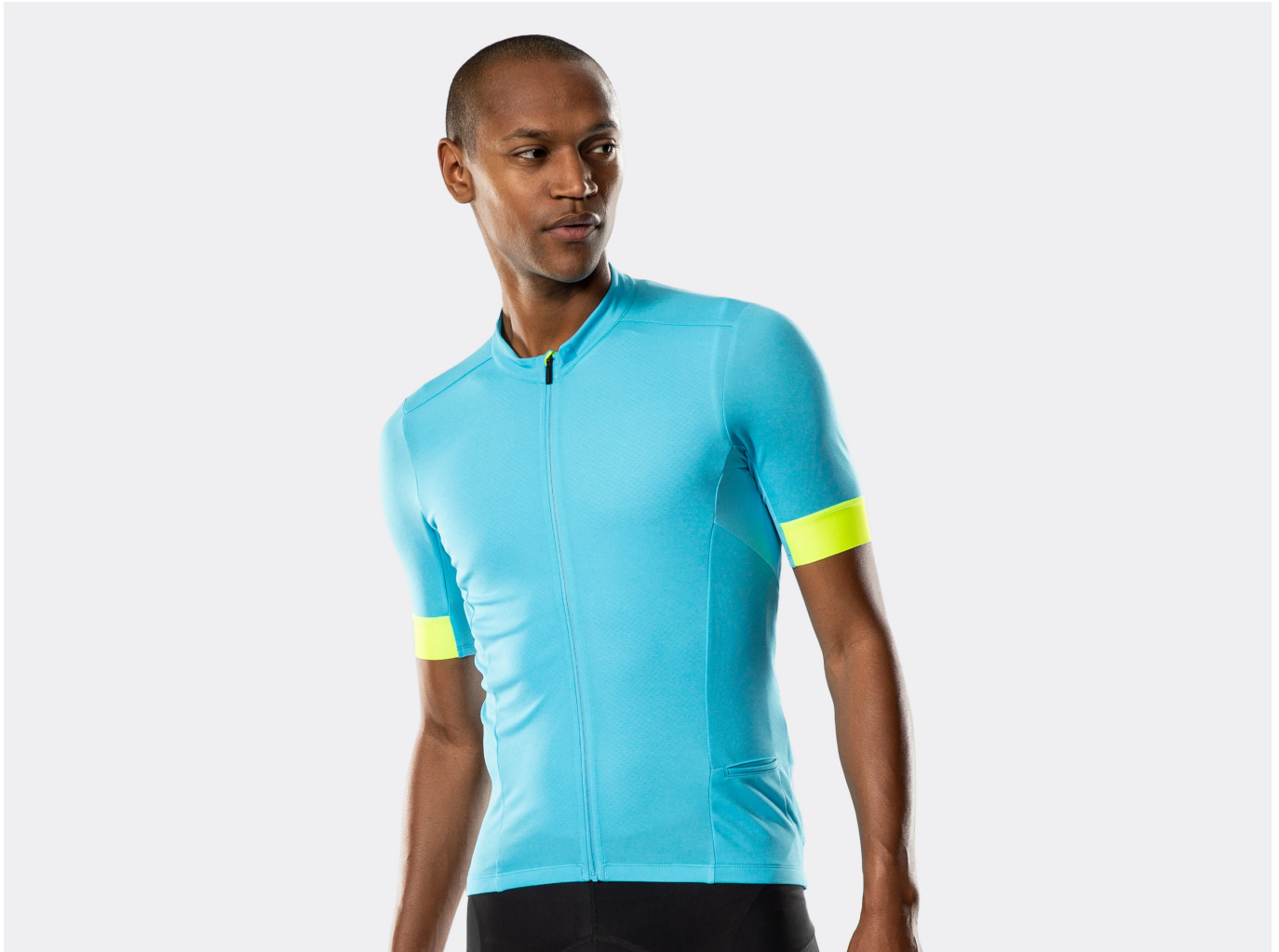
Bontrager Velocis Endurance Jersey in bluelight