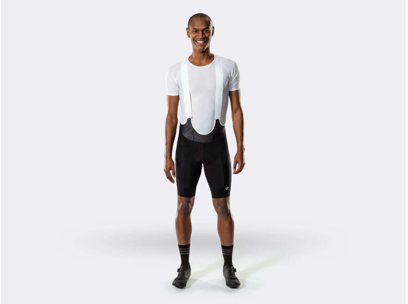
Bontrager Velocis Bib Short