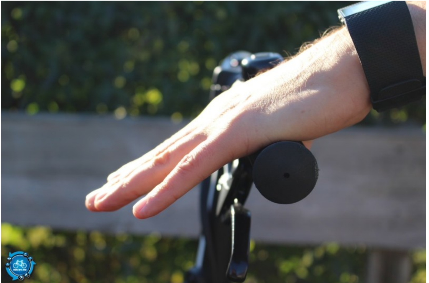
Optimale Position für den Bremshebel in Verlängerung des Armes ohne abgeknicktes Handgelenk oder Finger