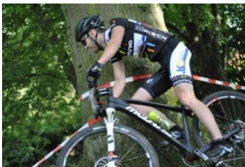
Archivbild Dominik

Im Lizenz Elite bzw. U23 Rennen war auch Dominik (Autor dieses Berichts) am Start. Der Teamfahrer des Radherstellers Müsing-Bikes fand zu Beginn eher schlecht ins Rennen und fand sich aufgrund kleinerer Fahrfehler im hinteren Feld wieder. Mit zunehmender Renndauer kam er jedoch immer besser ins Rennen: „Der Rennbeginn war etwas zäh. In den ersten Abfahrten hatte ich mit der extrem aufgeweichten Strecke Probleme. Mit zunehmender Renndauer kam ich aber immer besser ins Rennen. Die Strecke machte mit ihren Sprüngen echt Spaß, auch wenn alle Fahrer im Mittelfeld die Trail-Anstiege nur noch laufend bewältigen konnten. Am Ende bin ich mit meinem Platz 19 im gemischten Elite und U23 Feld gar nicht so unzufrieden, denn ein paar meiner bekannten Kontrahenten konnte ich noch hinter mir lassen. Mit den paar Punkten für