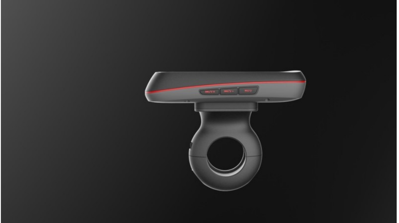
Klare Linien am neuen TIGER von Falk Outdoor

Um das Gesamtpaket des TIGERS abzurunden, erhält er auch noch eine neue Halterung.