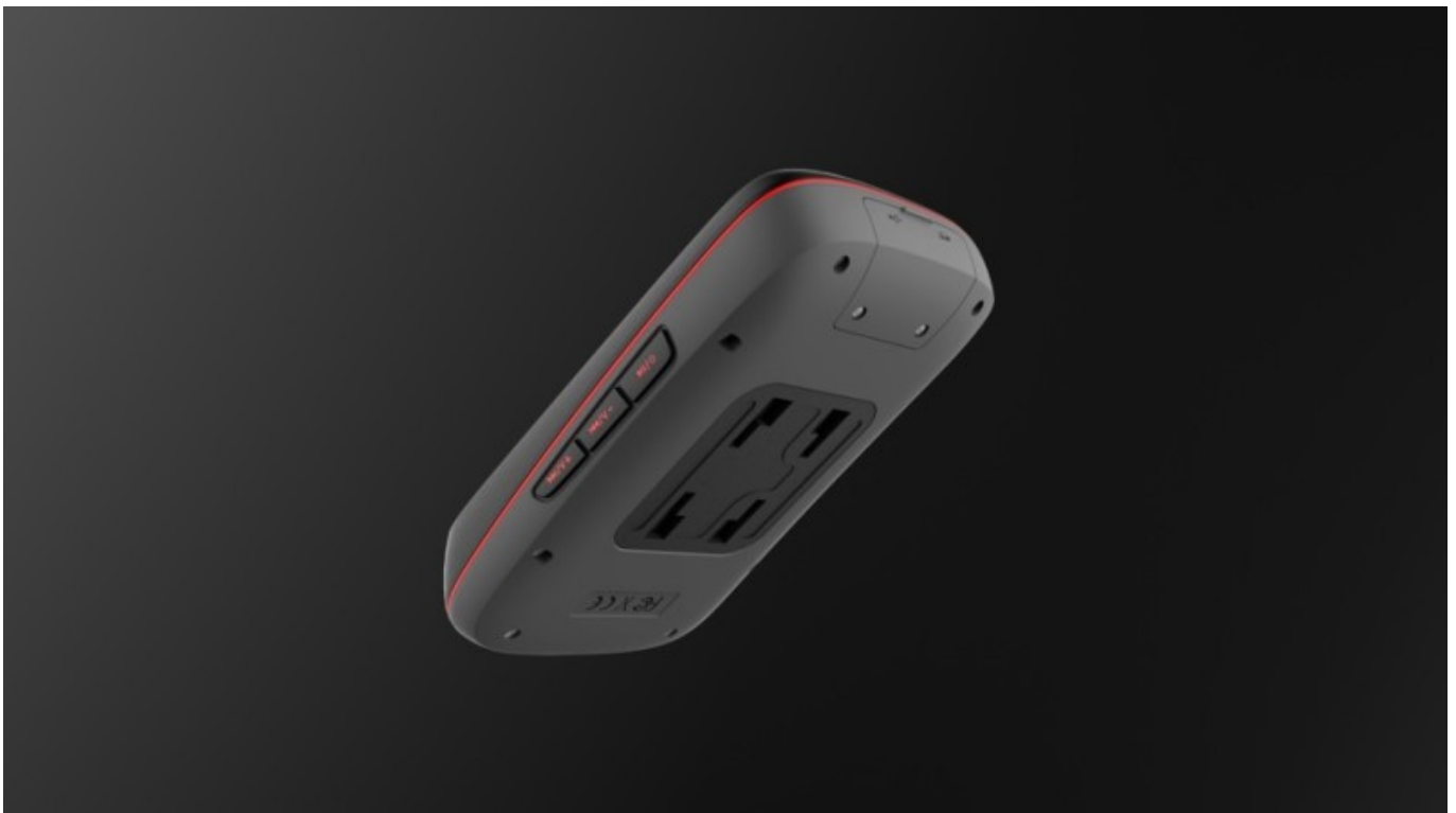
Neues Halterungssystem am TIGER

Um das Gesamtpaket des TIGERS abzurunden, erhält er auch noch eine neue Halterung.