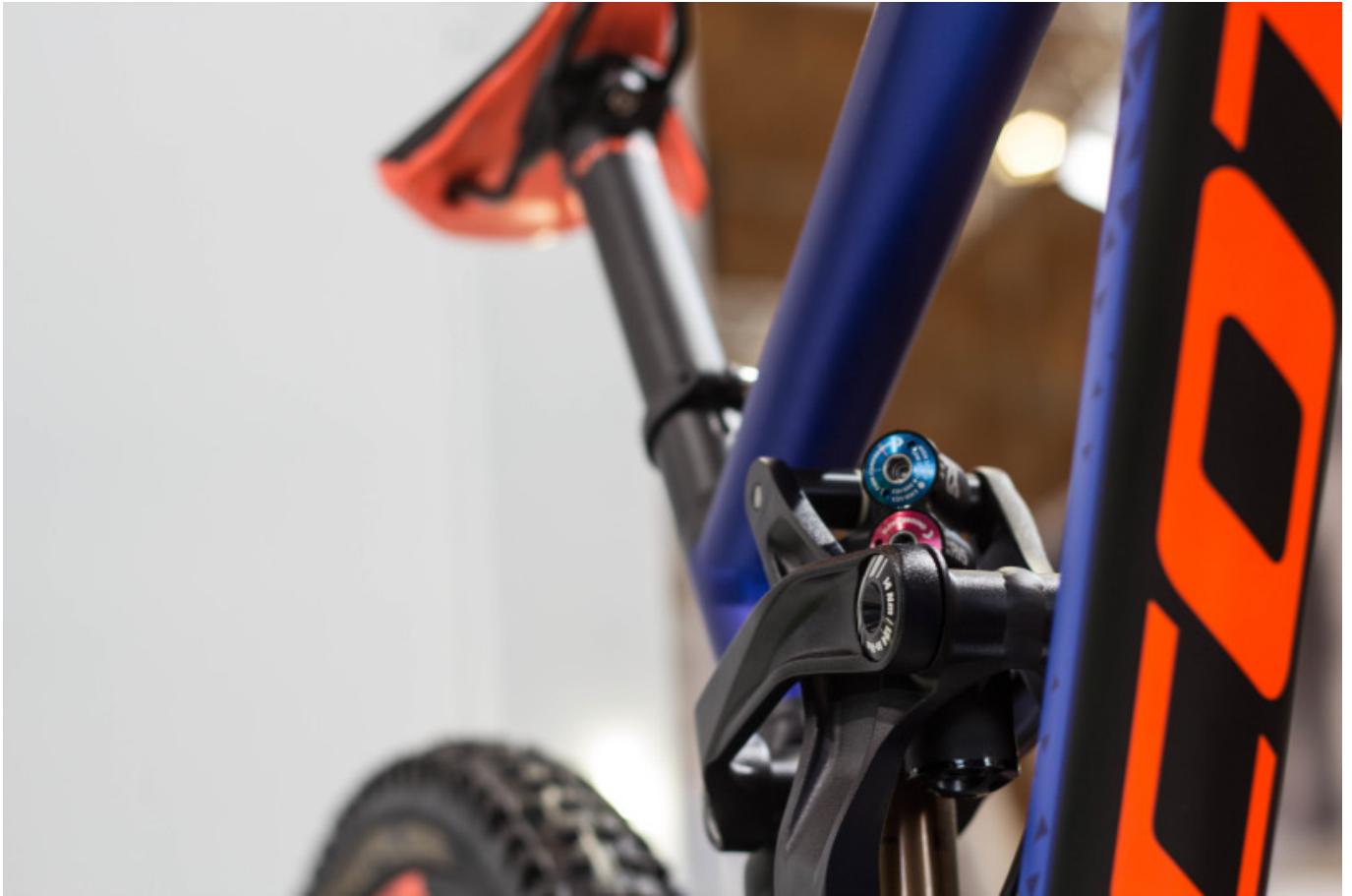
Allgegenwärtig - Foxs neuer Downhill Dämpfer