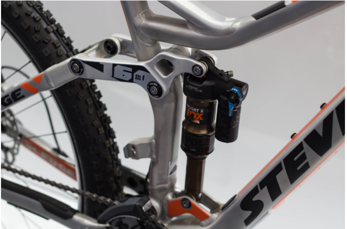
Spaßmaschine - Potenter Hinterbau am Stevens Sledge Max

Ja nachdem ich nun 2 Bikes aus der Mountainbike Sparte gefahren bin, wollte ich nun endlich mal ein Rennrad fahren, denn wirklich gefahren war ich noch nie eines. Fündig geworden bin ich hierfür bei BH Bikes welche nicht nur mit schicken Bikes überzeugten, sondern auch mit freundlicher Beratung und Betreuung, sympathisch!