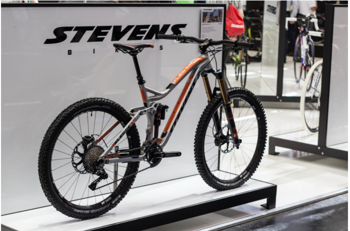
Das Stevens Sledge Max - 3699 €

Auf dem Weg zum Start des „Trails“ kann das Sledge Max natürlich nicht mit der Kletterfreude des Merida mithalten, lässt sich aber trotzdem willig auf den Berg pedalisieren. Sobald es bergab geht, ist das Bike jedoch in seinem Element, es überzeugt mit einem potenten Hinterbau und einer genialen Geometrie. Alles in allem lädt das Bike sofort zum verspielten Fahren ein und vermittelt das beliebte „im Bike sitzen“ doch sehr intensiv, das gefällt!