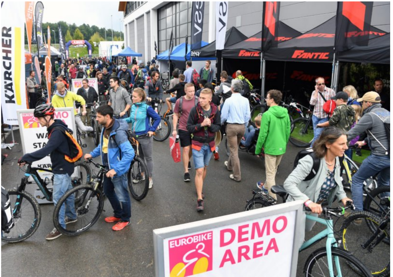
Freigelände: Demo Area