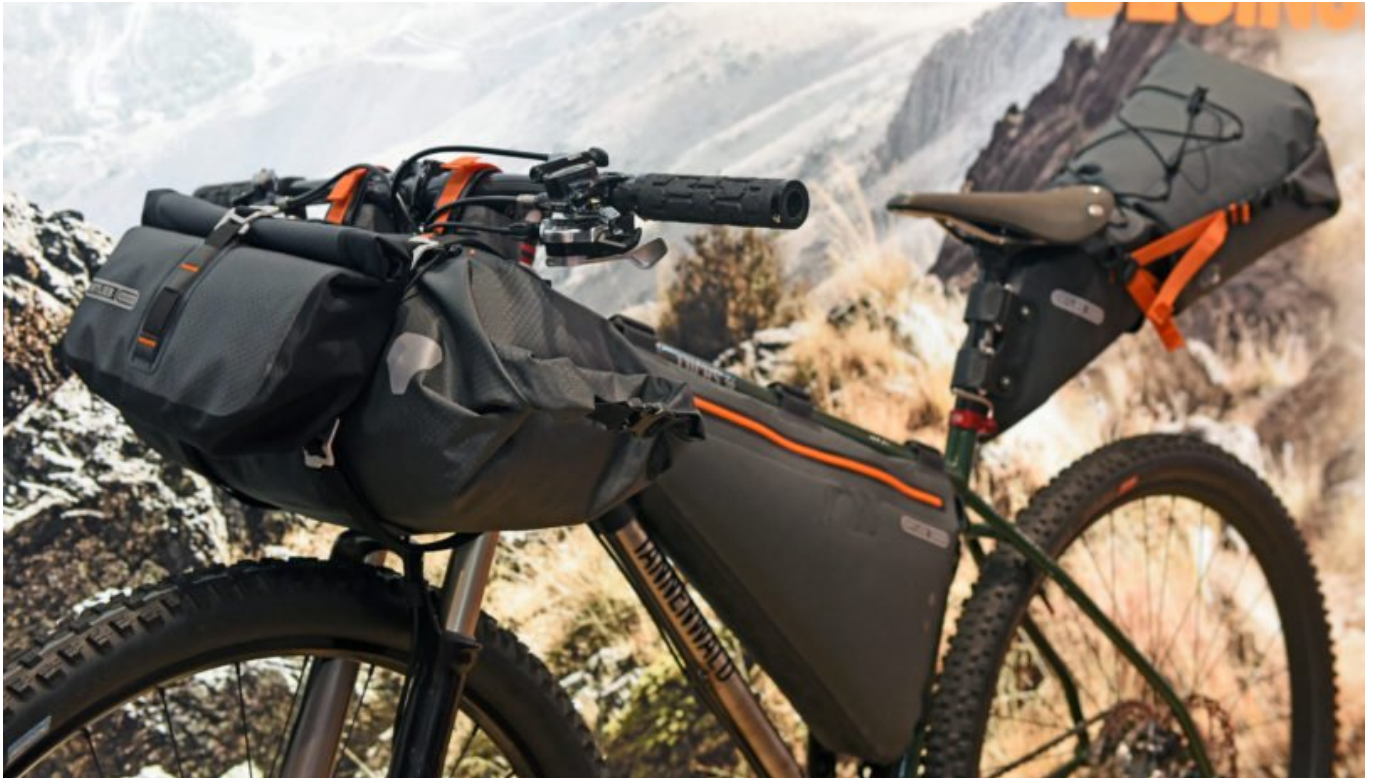
A3: ORTLIEB Bike Packing