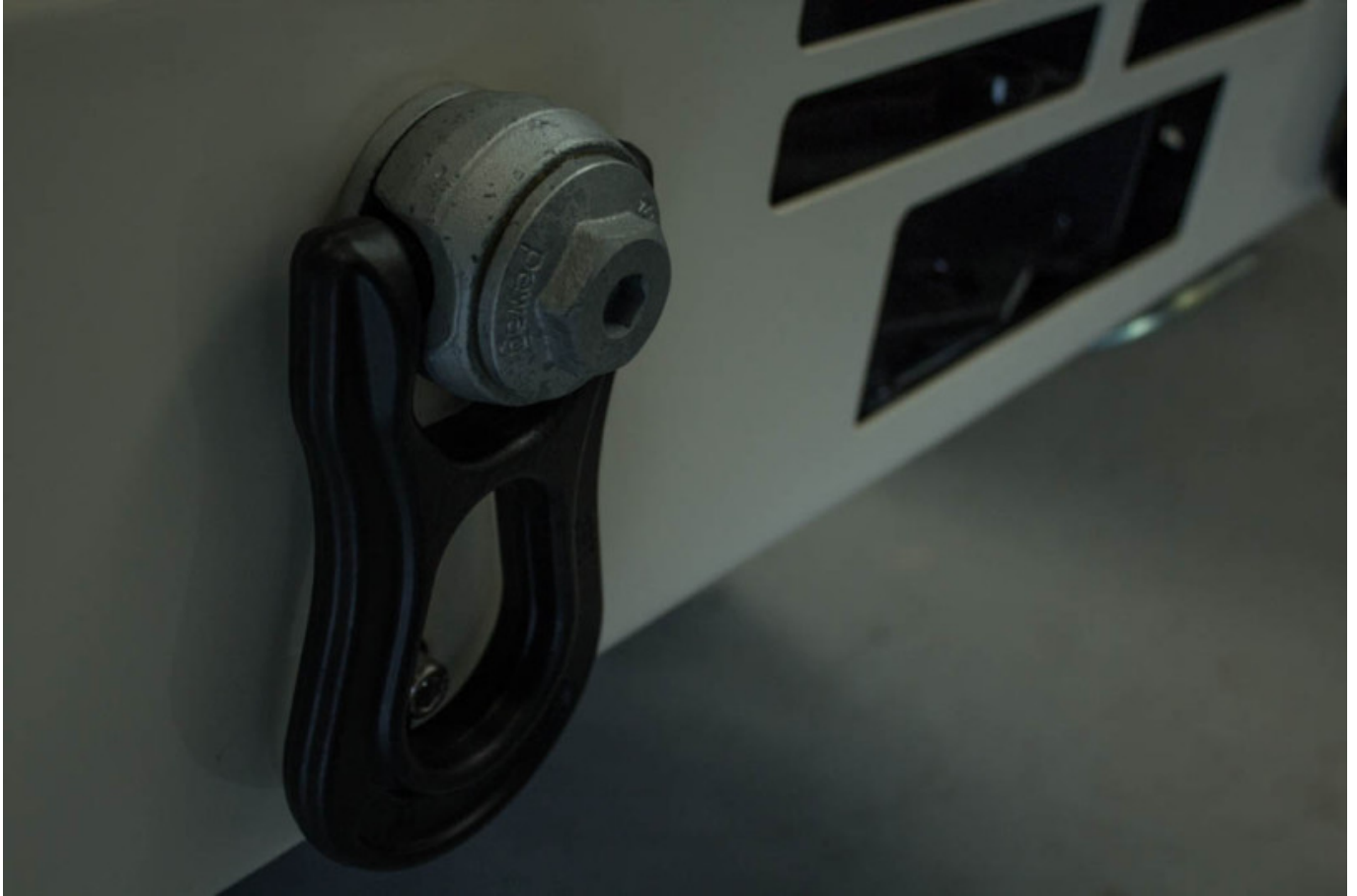
Abschlepphaken am Excap für brenzlige Situationen.

Excap - Der „Downhiller“ unter den Wohn- und Expeditionsmobilen.