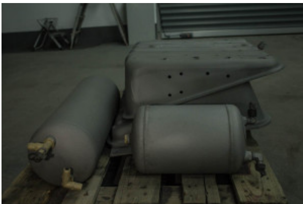
Sandgestrahlte Teile des Excap.

Nachdem das Führerhaus entkernt, aufbereitet und lackiert worden ist, geht es an die vielen Kleinteile welche bei der Demontage vom Rahmen montiert wurden. Je nach Zustand und Funktion des Teiles wird es entweder gegen ein neues getauscht, oder aufbereitet. Wenn es aufbereitet wird durchläuft es einen mehrstufigen Prozess in welchem es zuerst in einer Sandstrahlkabine sandgestrahlt wird um anschließend bei einem externen Verzinker mit einer Verzinkung gegen Rost geschützt zu werden.