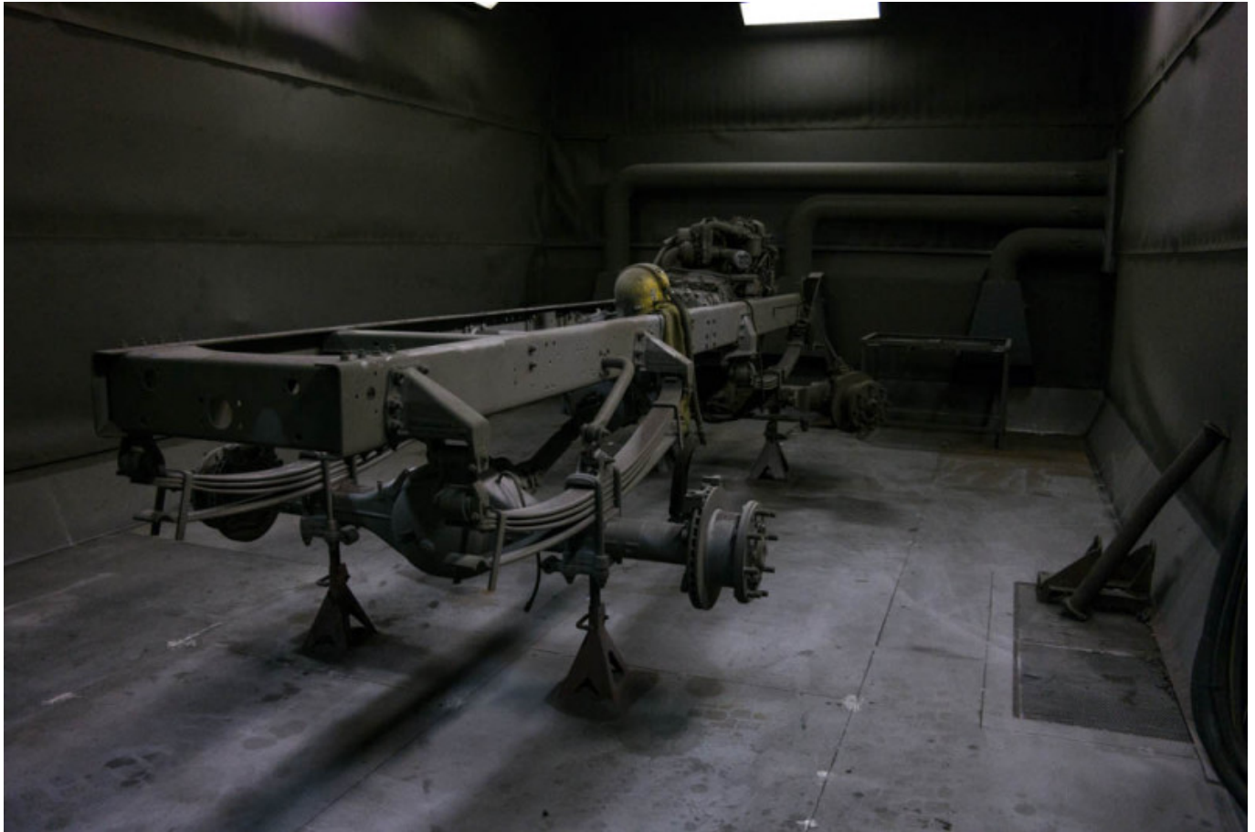
Sandstrahlhalle mit Rahmen

Parallel zum Strahlvorgang in welchem auch Achsen & Co gestrahlt werden, wird das Führerhaus komplett entkernt und bekommt eine neue Lackierung welche der Kunde selbst wählen kann. Auch erste Arbeiten im Innenraum, wie die Aufbereitung des Amateurbrettes, werden hier schon durchgeführt.