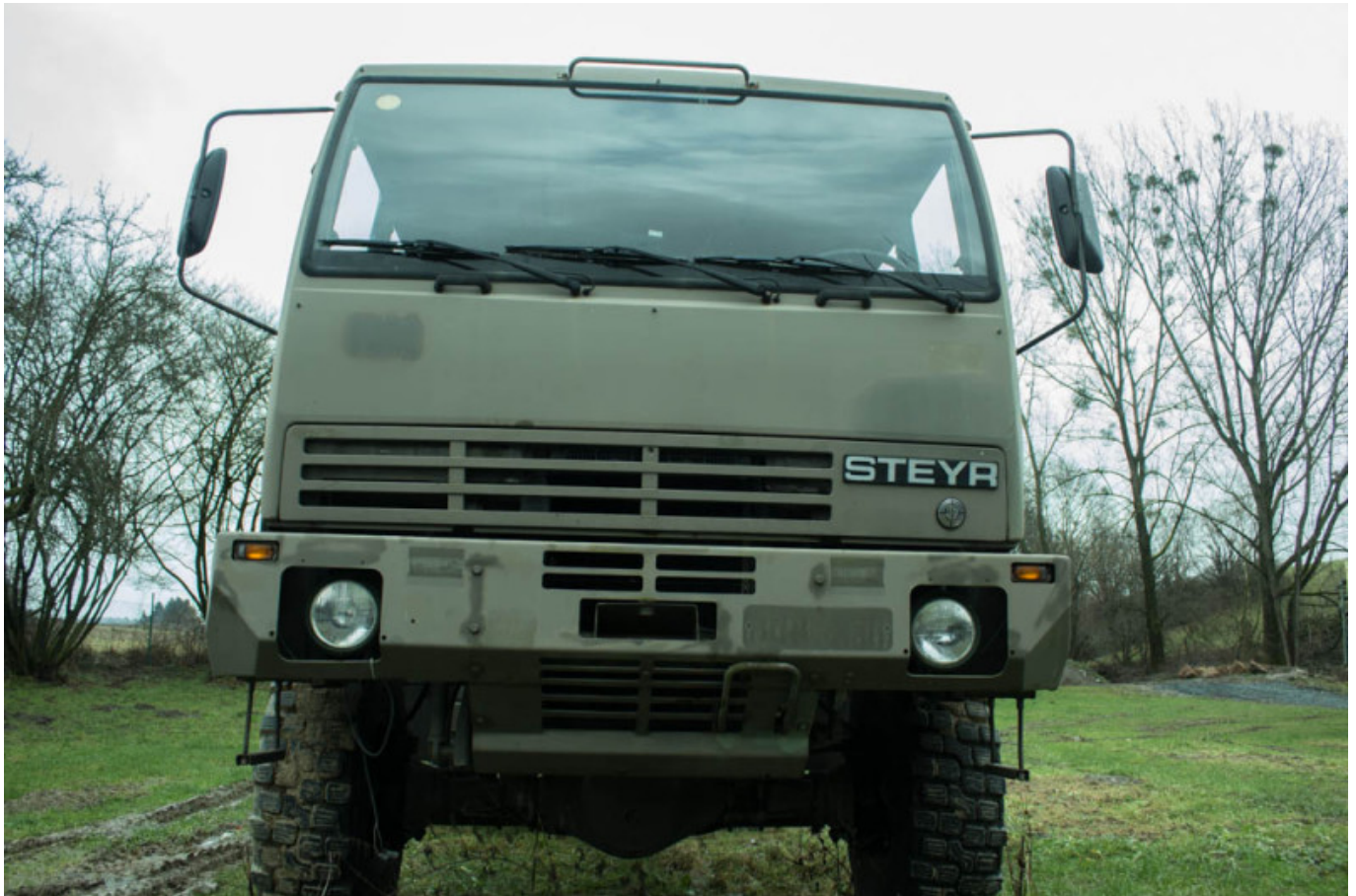
Ausgangsbasis Steyr 12m18

Im ersten Schritt wird der Steyr 12m18 bis auf den Rahmen komplett zerlegt, somit wird gewährleistet das erstens jedes Teil aufbereitet bzw erneuert wird und zweitens das der nun nackte Rahmen direkt in der hauseigenen Sandstrahlhalle abgestrahlt werden kann. Bei diesem Strahlvorgang werden alle Lackschichten vom Rahmen abgetragen und im Anschluss steht einer neuen, frischen Grundierung und Lackierung nichts mehr im Wege.