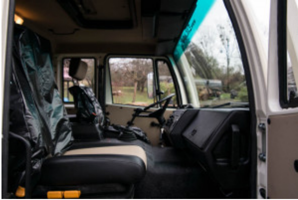
Frisch fertiggestellter Excap. (Plastikfolie zum Schutz der Sitze vor der Auslieferung)

meinen er sei gerade erst frisch vom Band gelaufen, den durch die konsequente Restauration steht er Tip Top da. Die neue Stoßstange, Lichter, Dachgepäckträger und andere Neuerungen fügen sich perfekt in das Gesamtbild ein und stellen zusammen mit den neuen, größeren Felgen und Reifen ein bulliges, aber keiner Zeit „prolliges“ Design dar. Auch im Innenraum ist die Handschrift von Excap zu erkennen, neu überzogene Sitze, Individualisierte Türverkleidungen und vieles mehr machen das ehemals triste Steyr Cockpit zu einem angenehmen Führerhaus auf Reisen.