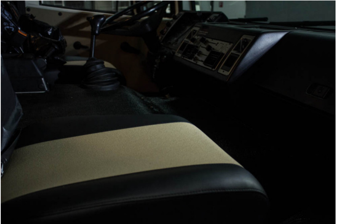
Aufbereiteter Sitz des Excaps

Excap – Der „Downhiller“ unter den Wohn- und Expeditionsmobilen.