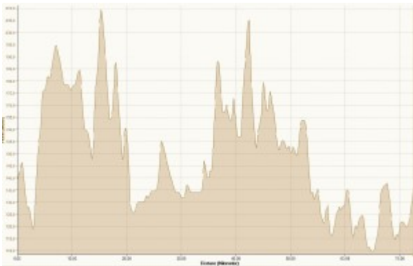
RTF-Klein-Karben Höhenprofil *

Wir waren heute beim RV Klein-Karben zu Gast. Da haben wir uns für die Strecke von gut 70 km entschieden. Das war am ehesten Familien kompatibel. Die Route führte auf einer welligen Piste durch die Wetterau im Bogen nach Büdingen und wieder zurück zum Start. Auch hier trifft man an den Verpflegungsstationen Fahrer aller Touren. Gefühlt steigt das Durchschnittsalter indirekt proportional zur Tourlänge. Wie sagte ein Teilnehmer unterwegs? Wenn's rollt, dann rollt's. Auf- und Absteigen ist manchmal etwas schwierig ☐