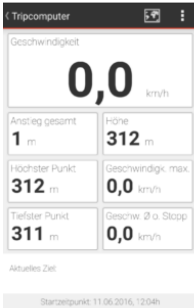
Tripcomputer Falk Outdoor Navigator