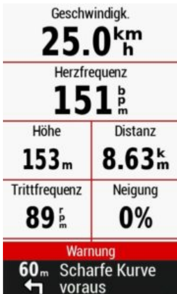
Garmin Edge 1030 Trainingsseite