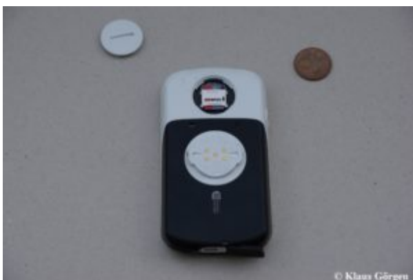
Garmin Edge 1030 SD Kartens Slot