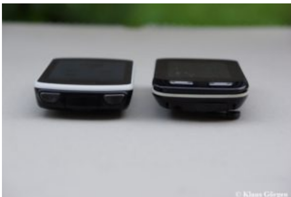
Garmin Edge 1030 Schalter