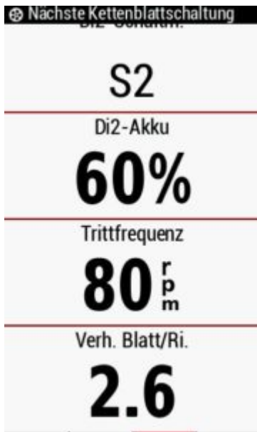
Garmin Edge 1030 Di2 Anzeige

Wir haben die gängigen Sensoren von Garmin aber z. B. auch die Di2 von Shimano oder Bluetooth Sensoren von Sigma ohne irgendwelche Probleme gekoppelt. Beim Starten wurden auch immer alle gekoppelten Sensoren am Rad gefunden und ihre Werte angezeigt.