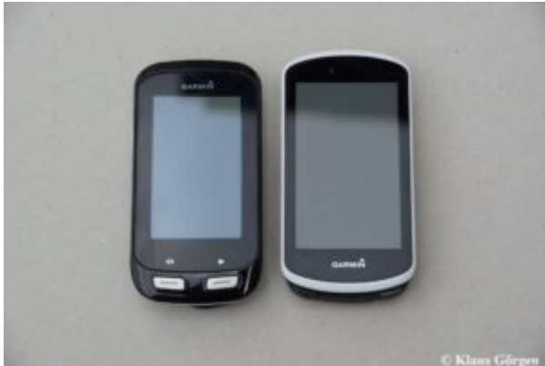
Garmin Edge 1030 im Vergleich mit dem Edge 1000

Die Start- und die Rudentaste sind jetzt nicht mehr auf dem Gehäuse, wie beim Edge 1000, sondern unten am Rahmen zu finden. Je nachdem wo und wie der Edge am Rad angebracht ist, sind sie so schwer erreichbar. Je nach verwendeter Halterung (Gummiringe) muss man den Edge auch beim Drücken zusätzlich oben am Rahmen festhalten, um den nötigen Druck auf die Taste zu bekommen. Auch das ist lästig.