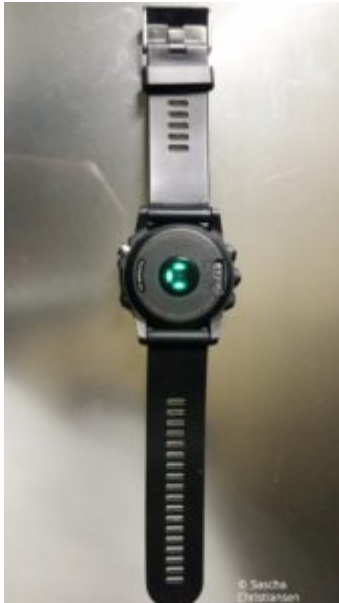
Fenix 3 Herzfrequenzsensor