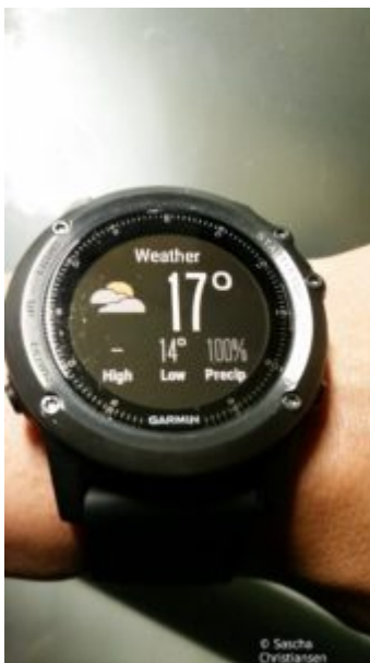
Fenix 3 Wetter

Nachts misst die Fenix 3 meinen Puls und wertet am nächsten Tag meine Ruhephasen aus, leider jedoch fließt diese Erkenntnis nicht in die Softwareupdate Benachrichtigung ein. So wurde ich während des Schlafs zweimal geweckt, irgendein Update zu bestätigen. Fail! Leider versteht die Uhr auch nicht, wenn man sie mal ablegen möchte. Fortwährend leuchten die grünen LEDs auf der Suche nach einem Puls.