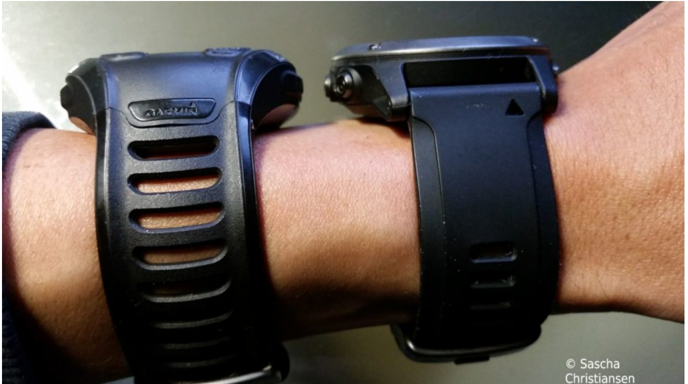
Fenix 3 Vergleich mit 910 XT