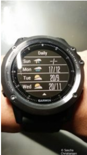
Fenix 3 Wettervorhersage