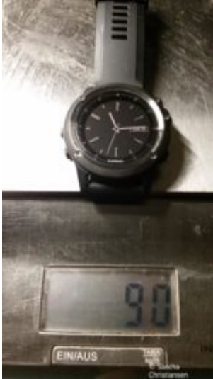
Fenix 3 Gewicht

Zum ersten Mal in der Hand, macht die Fenix 3 HR Saphir einen wertigen Eindruck. Die Brillanz des Saphirglases fällt sofort ins Auge und gibt den Blick auf das kontrastreiche Farbdisplay frei. Zusammen mit dem massiven Armband bringt die Uhr aber auch fast das Gewicht einer Tafel Schokolade auf die Waage nämlich 90 g und damit 19 g mehr als die 910 XT.