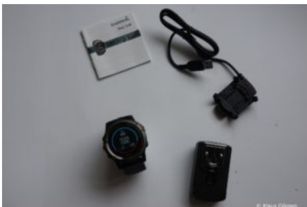
Fenix 3 Lieferumfang