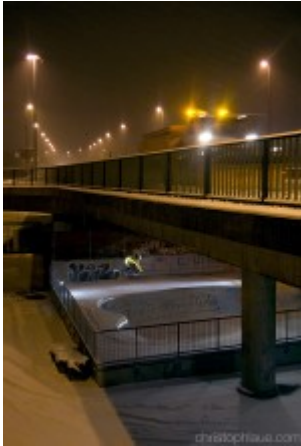
Rider Philipp Rösing

Man muss z.B. nicht alle erklärenden Elemente in ein Bild packen, dass man das Bild verstehen kann. Verschiedenen Perspektiven können so zusammen geschnitten werden, das sie eine Sprung super zeigen.