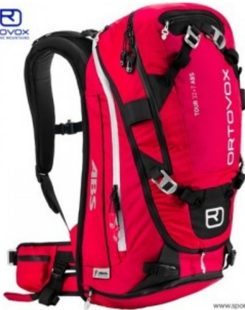
www.sport-bittl.de ABS Rucksäcke

Der neueste Trends in Sachen Backpack sind dieses Jahr Rucksäcke mit eingebautem Airbag. Deuter und Ortovox beispielsweise bieten hier ein Gaskartuschensystem mit herausnehmbarem Airbagsack an. So kann dieser für kleinere, ungefährlichere Touren heraus genommen werden. Die Hersteller Pieps und Black Diamond haben sich ein anderes System einfallen lassen, welches mit den Nachteilen des Gassystems kurzen Prozess macht: Der Jetforce Rucksack, der über eine batteriegetriebene Luftpumpe den Airbag füllt. Damit ist es möglich den Airbag 4x wiederaufzublasen ohne, dass die Batterie aufgeladen werden muss.