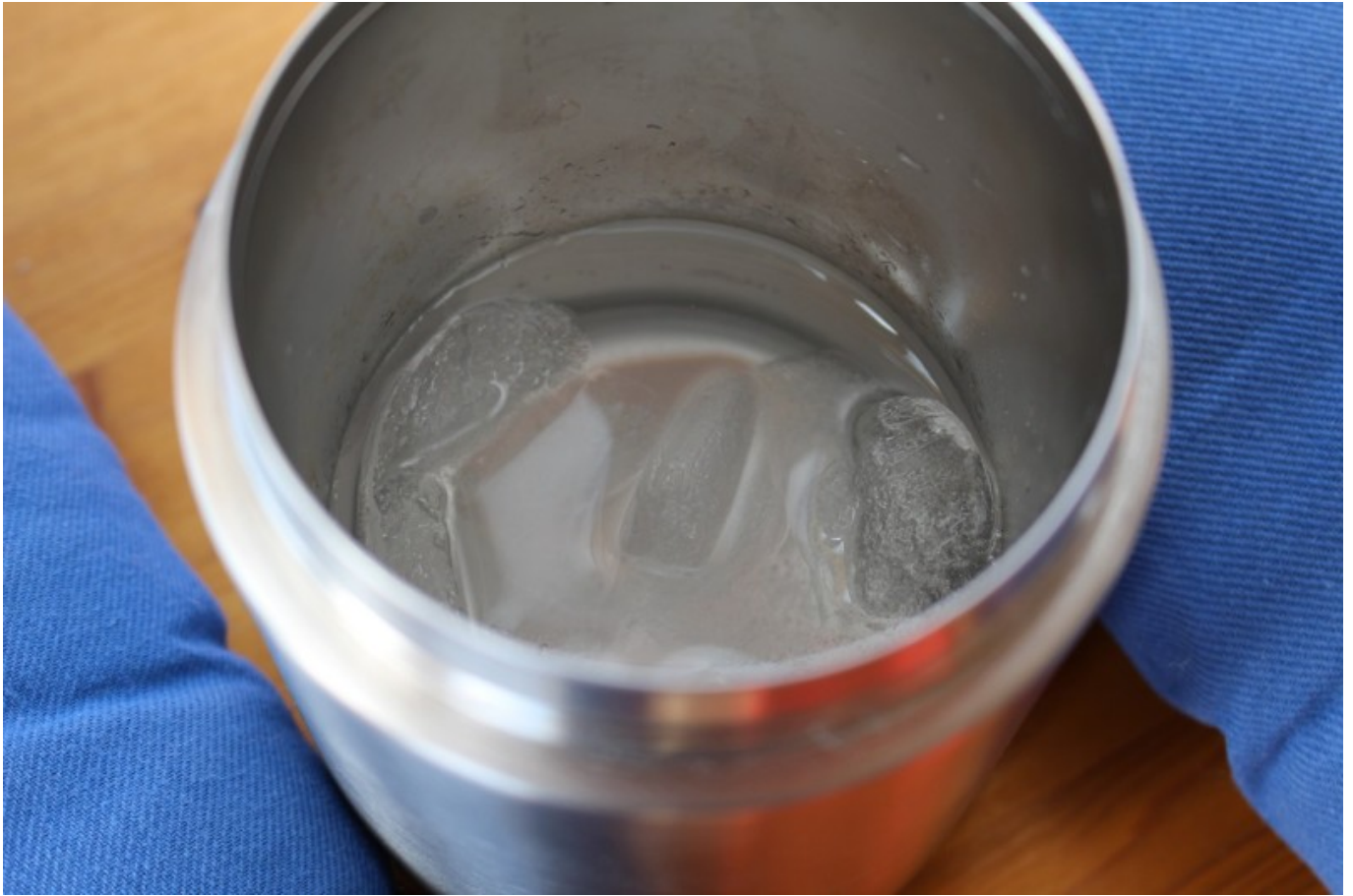
Eisreste nach über 20 Stunden im Behälter

Der Kanister selber bringt ein Leergewicht von gemessenen 359 g auf die Waage und ist bei entsprechender Befüllung natürlich etwas schwerer. Er hat einen Durchmesser von 9,5 cm und eine Gesamthöhe inklusive Deckel von 14 cm. Logischerweise trägt der Kanister im Rucksack entsprechend dick auf. Die Tourenfahrer dürften aber dieses Behältnis eher in den Satteltaschen mit sich führen.