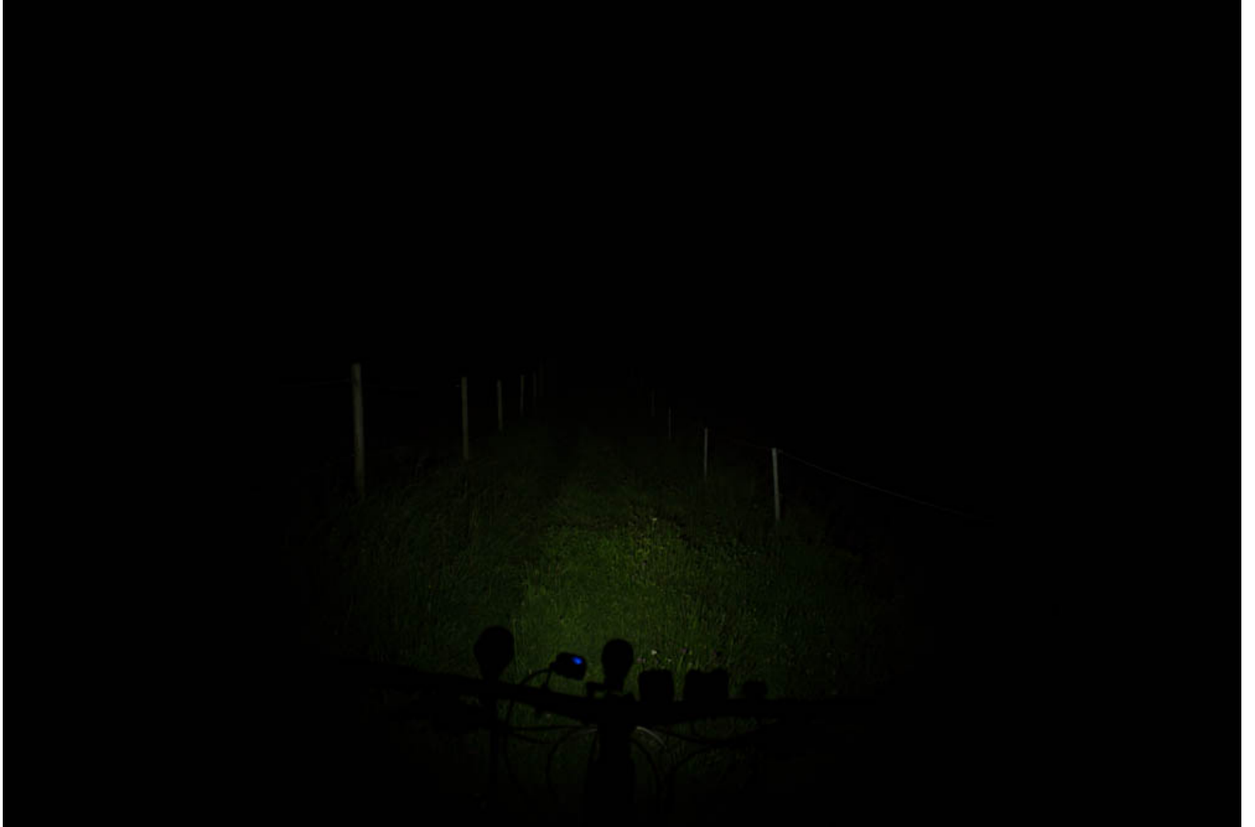
40 Lumen (maximal 80h Akkulaufzeit)