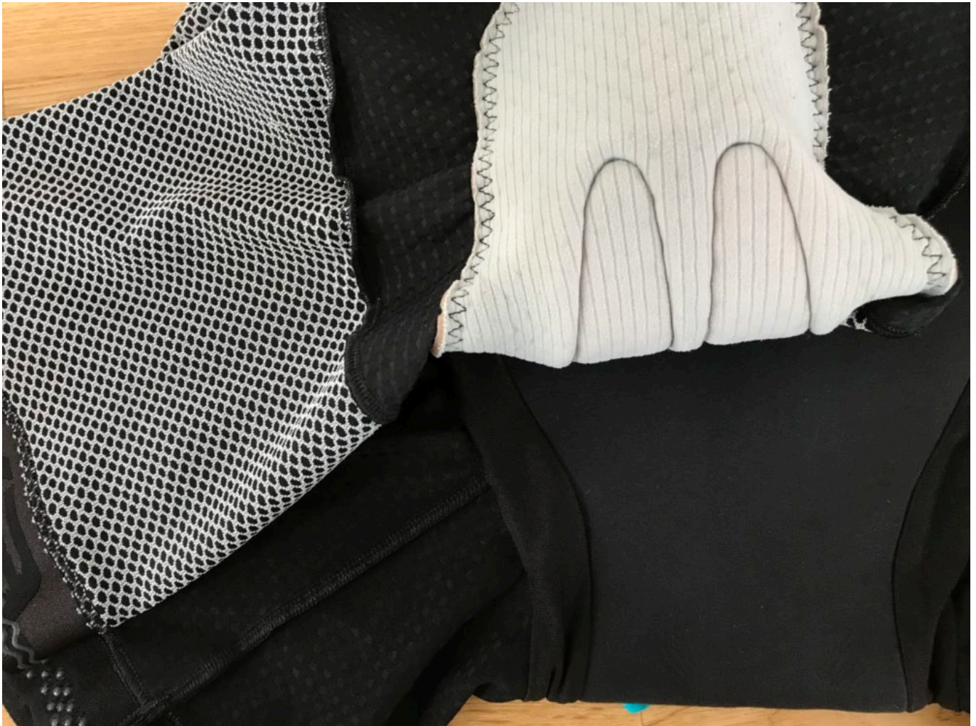
Unterschied Leverage (oben) und Everve (unten)

Somit kann man Everve's Neustart als absolut erfolgreich werten.