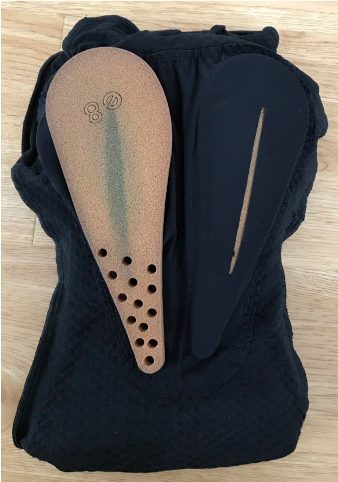
individuelle und austauschbares Polster