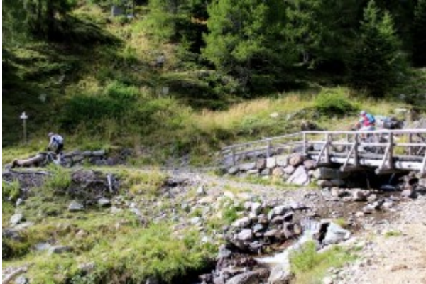
Der Weg an sich ist beim entspannten Dahinrollen in den Bergen schon eines der eigentlichen Ziele.