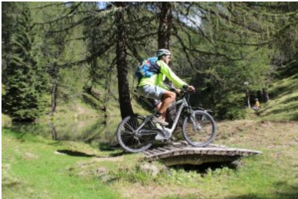
...vorbei an wunderschönen kleinen Bergseen in unberührter Natur.