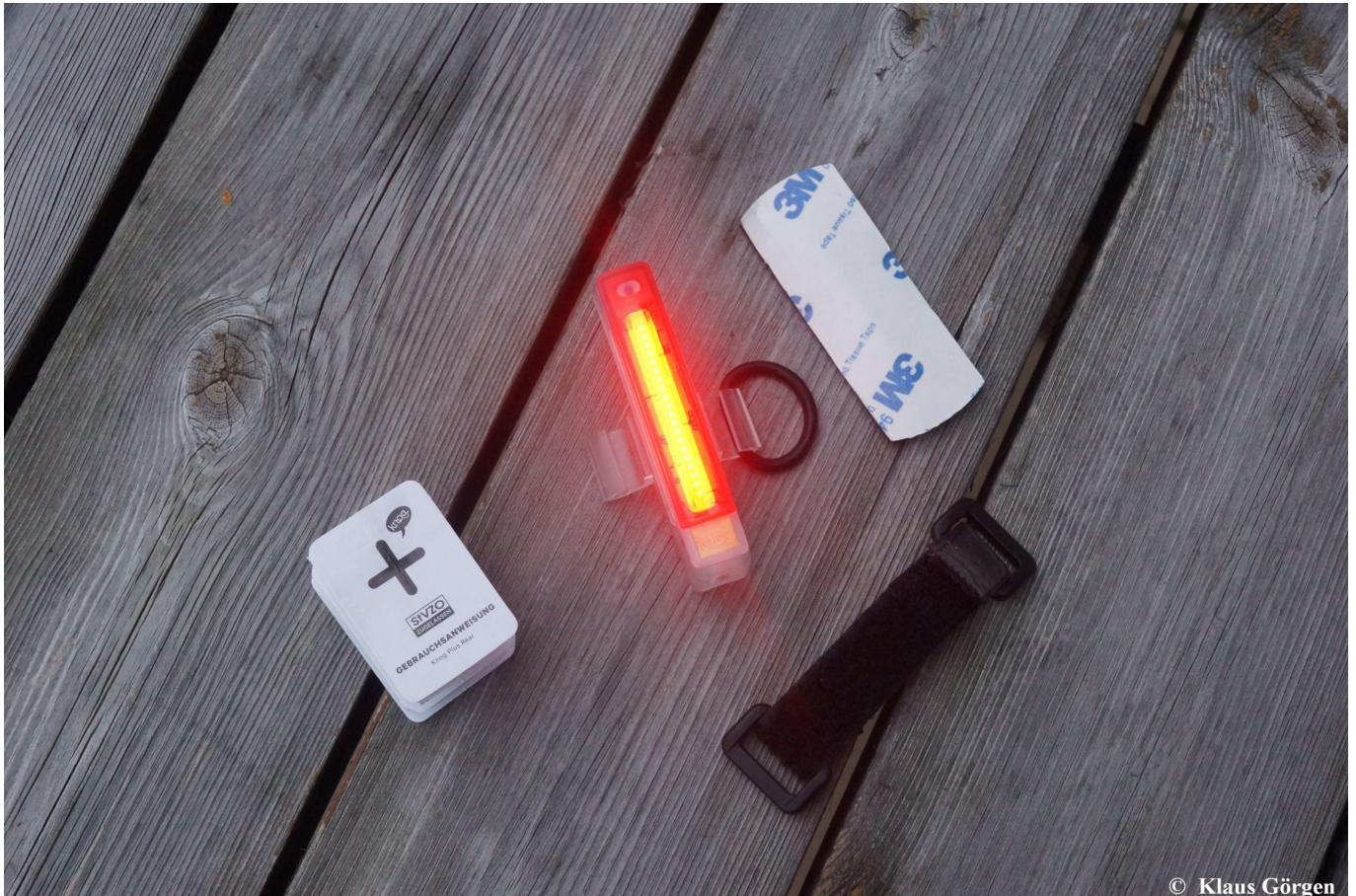
Knog-Leuchte mit Zubehör

Das Rücklicht von Knog ist klein, leicht, pfiffig gemacht und leicht zu montieren. Aber der Reihe nach.