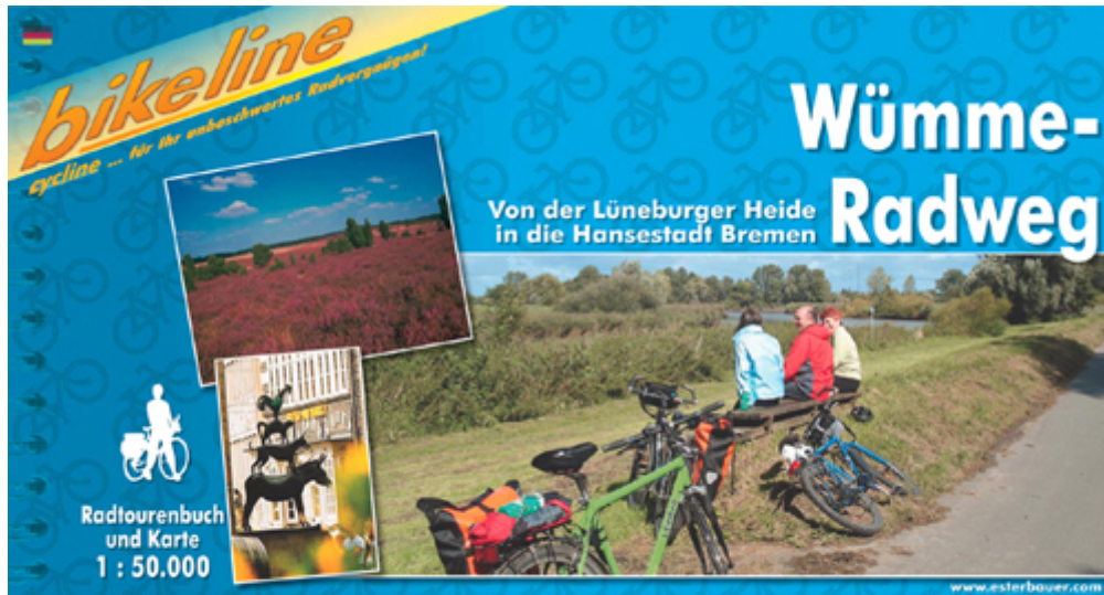
Titelbild des neue Radtourenbuch zum Wümme-Radweg

Das neue original bikeline-Radtourenbuch ist mit vielen Fotos, Karten und Serviceinfos der perfekte Begleiter für Ihre nächste Radtour! Die Karte enthält das gesamte Radwegenetz des Wümme-Radweges mit Startpunkt in Rotenburg (Wümme). Präzise Karten, exakte Streckenbeschreibungen, zahlreiche Stadt- und Ortspläne, Hinweise auf das kulturelle Angebot der Region und ein ausführliches Übernachtungsverzeichnis – das neue Radtourenbuch erleichtert eine entspannte Radwanderung entlang der Wümme.