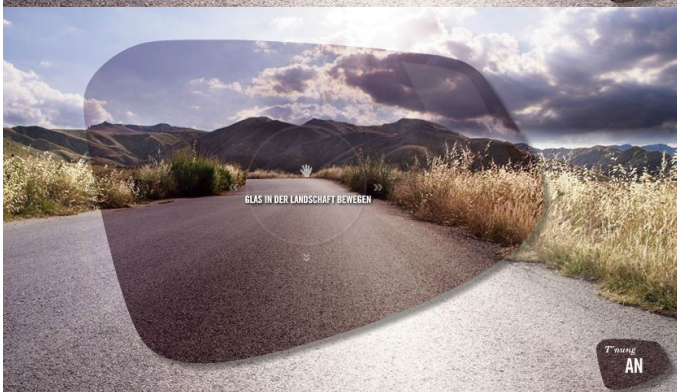
Dies sieht in echt dann im Grunde so aus