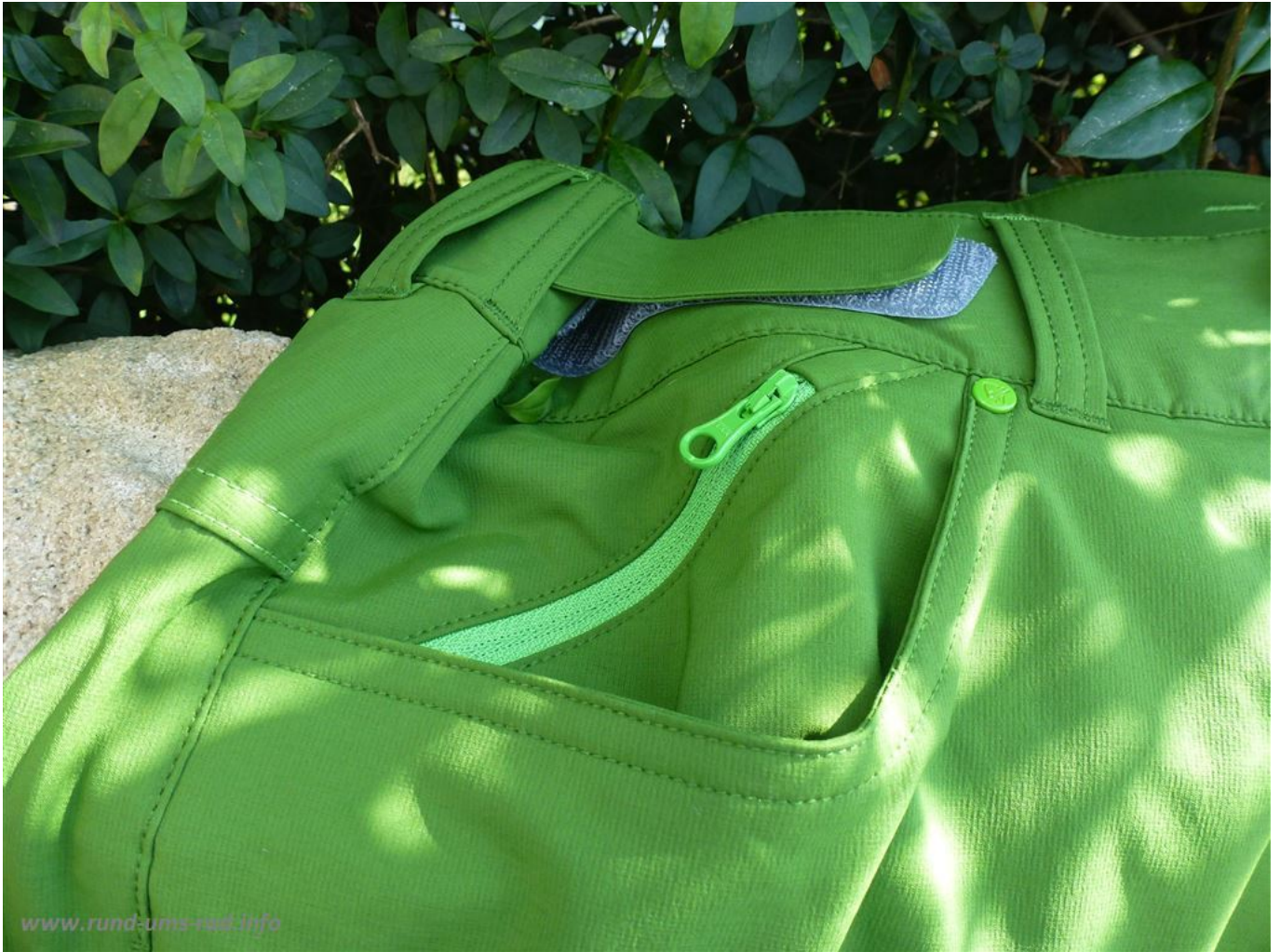
Tasche rechts mit Reißverschluss