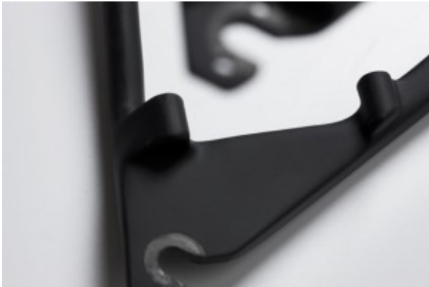
Minimalistische Scheibenbremsaufnahme an der Kettenstrebe