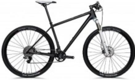
871g Carbon vereint zu einem wettkampftauglichen 29er Rahmen

Ein 29er Hardtailrahmen, der nur 871g wiegt? Das kann doch nicht sein, das schaffen Scott und Cannondale auch nicht!...doch das kleine Newcomer-Unternehmen OpenCycle zeigt wie es geht! Open, offen für neue Ideen. Hier der besondere Werdegang der beiden Gründer, sowie natürlich auch alle Details zum Rahmen.