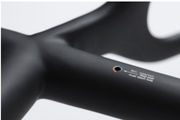
Ein einfaches Loch im Rahmen zeigt, ob die Sattelstütze weit genug im Rahmen steckt, um die Kräfte besser zu verteilen und den Rahmen zu schützen.