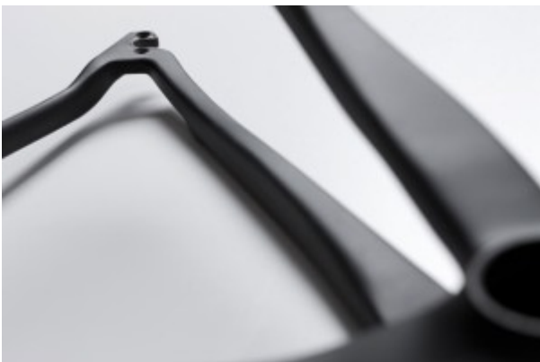
Semi-Flex Streben. Vertikal schmal, horizontal breit. So kann