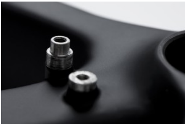
S3 Montagestandard für den Umwerfer am Sitzrohr