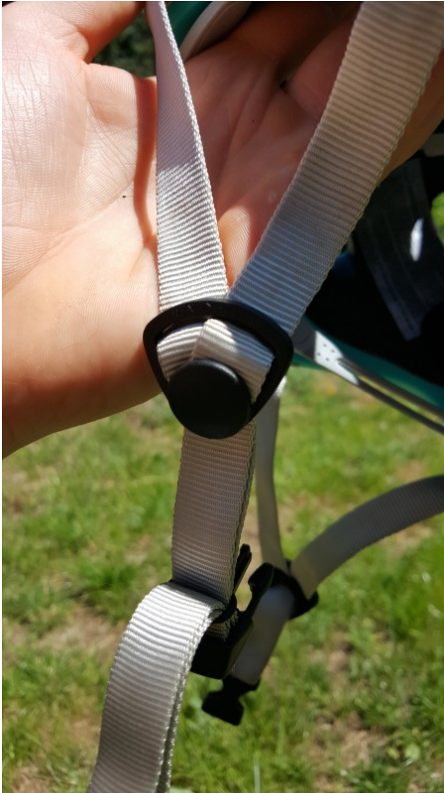
Einstellung des Kinngurtes

Die Verstellsystem ist insgesamt auf Einfachheit getrimmt - alles funktioniert sehr simpel. Ein paar Nachteile