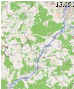
13.05.2012 Teil 1