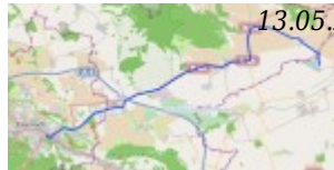
13.05.2012 Teil 2

Heute hat sich mein Leichtsinns gerächt, ich hätte gestern doch auf das Bier verzichten sollen. Dennoch, nach einem guten Frühstück ging es wieder auf das Rad erst einmal entlang des Stausees bei Bad Soden in Richtung Fulda. Von da an auf in die Rhön ich habe mich zwar bei meiner Planung bemüht nicht jede Steigung mit zu nehmen aber wer schon einmal durch die Rhön gefahren ist, weiß das sich lange und teilweise heftige Steigungen nicht vermeiden lassen. Zähne zusammenbeißen und durchhalten war angesagt, schließlich wollte ich noch bis Eisenach. Auch wenn die Strecke anstrengend war so wurde ich doch durch abwechslungsreiche Landschaft entschädigt. Lohn der Anstrengung war ein Idyllischer Campingplatz mit einem kleinen See nicht weit von Eisenach. Zu meinem Glück hatte die Zeltplatz Gaststätte noch ein ansprechendes Abendbrot. Auch die Betreiber waren sehr nett und zuvorkommend. Da es noch in der Vorsaison war konnte ich in der Nacht vom Sonntag zum Montag den Campingplatz für mich alleine nutzen, alle Camper waren abgereist. Spätestens am Morgen sollte ich wissen warum. Die Nacht war mit -3°C recht frisch auf dem Überzelt hatte sich Raureif gebildet, und ich erwachte mit klappernden Zähnen, da meine Ausrüstung wohl doch nicht für Minusgrade geeignet war.