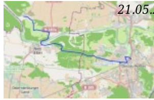
21.05.2012 Teil 2

Lieber Leser, Teile dieser Tour können gern nachgefahren werden, ich habe vor 8 Jahren nach 30 Jahren Pause wieder mit dem Radfahren begonnen bin jetzt 56 und schreibe diesen Bericht weil ich mir die Tour noch einmal in Erinnerung gerufen habe. Im kommenden Jahr werde ich diese Tour in abgewandelter Form wiederholen und freue mich jetzt schon darauf.