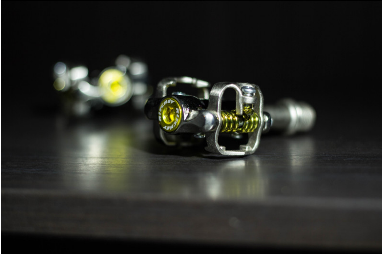
Ritchey WCS Pedal mit Akzenten.

Nicht ganz so akzentreich präsentieren sich hier die einfach silbernen Einsätze für die Schuhe, welche aber trotzdem mit einer gleichen, guten Verarbeitungsqualität wie schon bei den Pedalen selbst überzeugen.