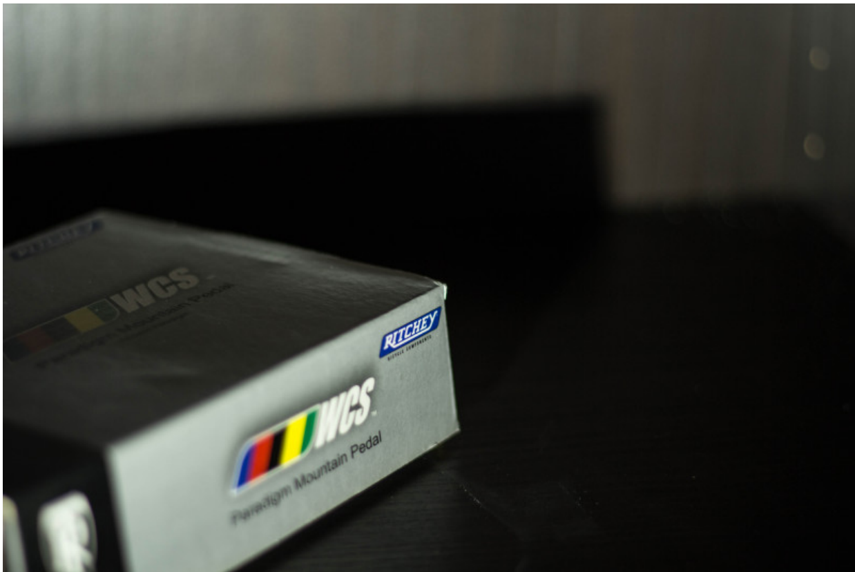
Verpackung des Ritchey Pedals

Doch macht sich dieser Preis auch bezahlt? Genau diese Frage stellten wir uns auf und testeten die Pedale ausführlich.