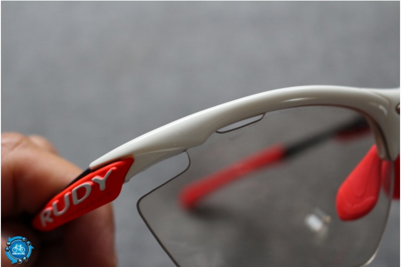
Vent Controller™ offen