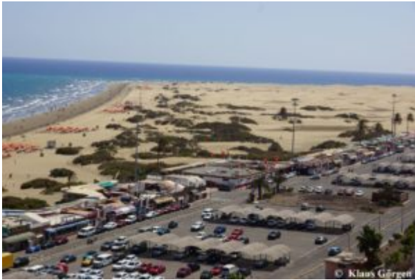
Corallium Dunamar: Blick auf Strand und Dünen

Nach einer grundlegenden Renovierung ist das Hotel im August 2018 wieder eröffnet worden. Gut die Hälfte der 243 Zimmer blicken direkt auf's Meer.