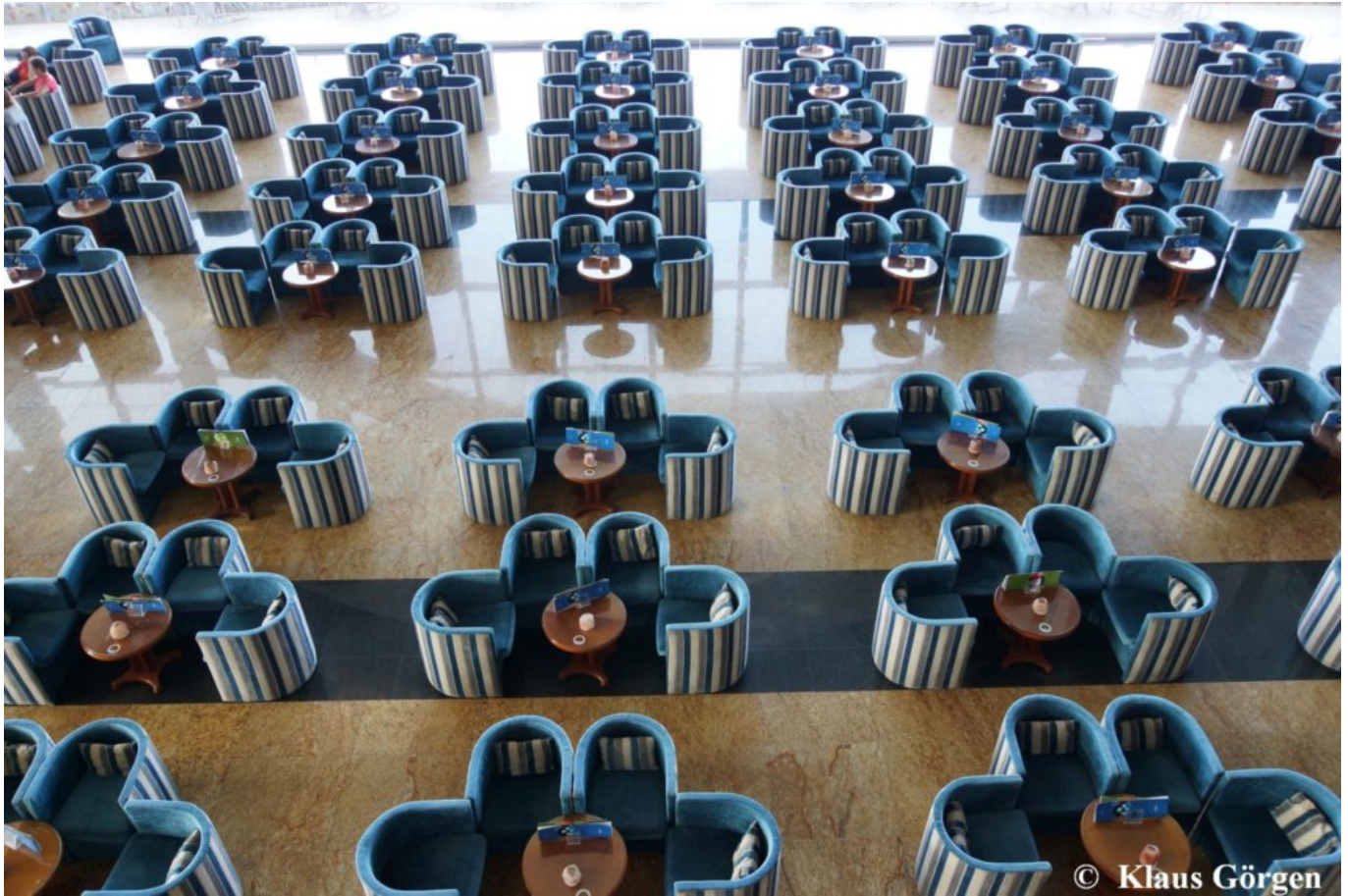
Gloria Palace Amadores: Warten auf die Abendveranstaltung