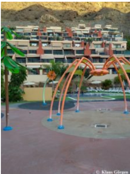
Cordial Mogán Valle: Kinderspielplatz

Das Cordial Mogán Valle liegt am Ende der Autobahn im Süden Gran Canarias in Puerto de Mogán. Es gehört mit dem Cordial Mogán Playa zu einer Kette, die insgesamt 11 Hotels auf Gran Canaria sowie ein Hotel auf Lanzarote betreibt. Hier brauchten wir keine extra Führung. Da wir hier gewohnt haben, hatten wir ausreichend Zeit, uns umzuschauen. Einige statistische Informationen haben wir „nebenan“ im Cordial Mogán Playa aufgesammelt.