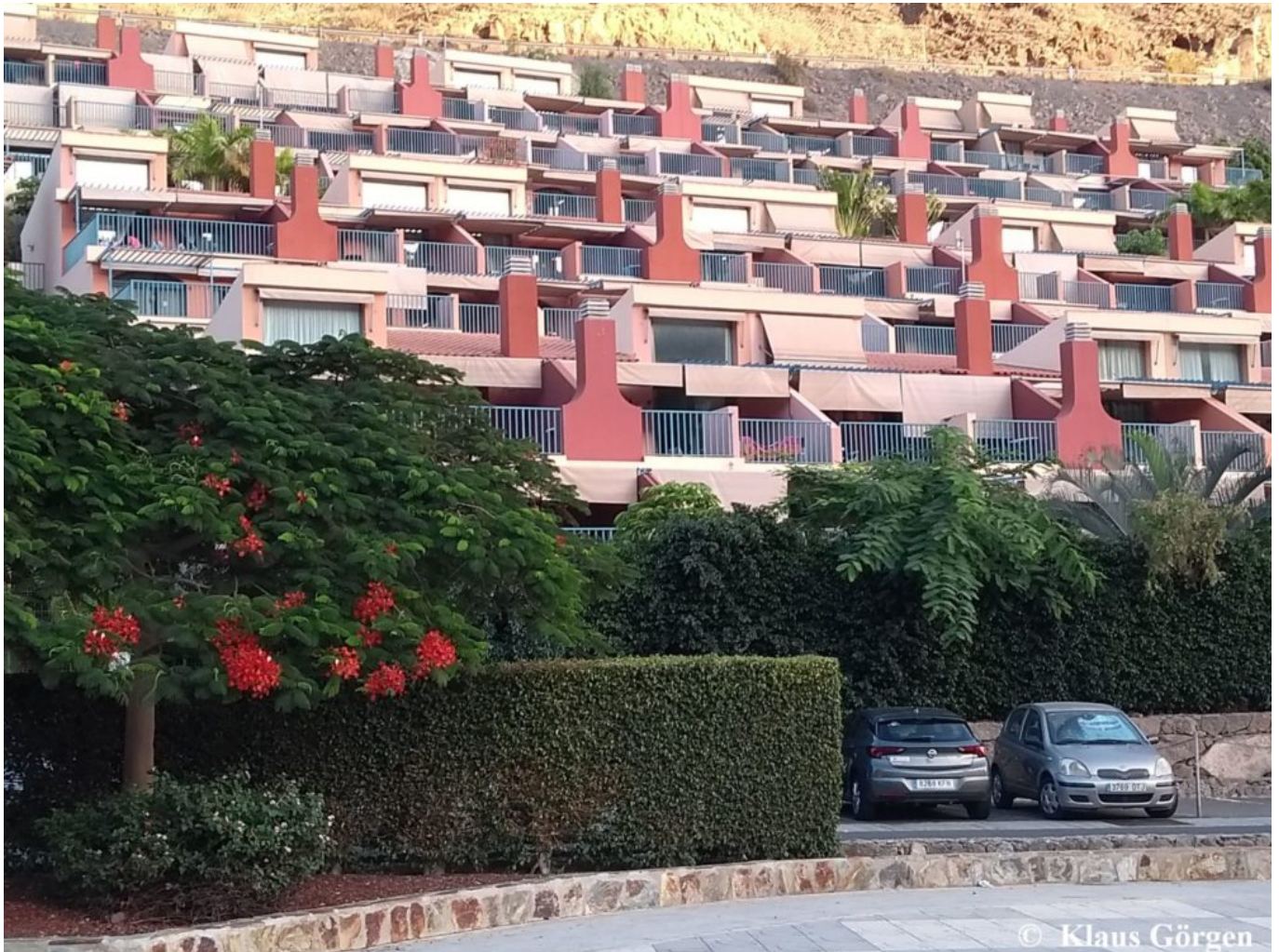
Cordial Mogán Valle

Wir haben insgesamt vier Hotels besucht, die alle was „Eigenes“ hatten. Die Hotels wurden uns von unseren Ansprechpartnern präsentiert, die unsere Fragen geduldig und kompetent beantwortet haben. Schauen wir uns die einzelnen Hotels an.