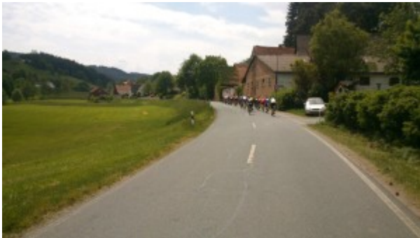
Starckenburg-RTF auf dem Weg nach Weschnitz **

Durch Höchst ging es zum Mümlingtalradweg, dem wir gute 10 km folgten. Der Weg ist landschaftlich teilweise wunderschön, für eine große Gruppe allerdings reichlich eng und bei Gegenverkehr auch nicht ungefährlich. Einige harmlose Spontan-Abstiege vom Rad verliefen aber ohne weitere Folgen. Bei Zell verließen wir den Radweg und begannen den nächsten Anstieg, der uns am Ende nach Mossautal führte. Die gewohnte „Raststätte“, das Restaurant der Schmucker Brauerei war leider geschlossen, aber wir haben gleich um die Ecke Asyl für unsere Mittagsrast bei km 67 gefunden. Mehr als die Hälfte der Strecke lag schon hinter uns und mit Nudelsalat, Tomaten, Gürkchen, Fleischwurst und natürlich Streuselkuchen wurde eine ausreichende Grundlage für die Weiterfahrt gelegt. Nach der Mittagspause gab es noch die Gelegenheit in die langsamere Gruppe 119/24 zu wechseln (oder auch umgekehrt).