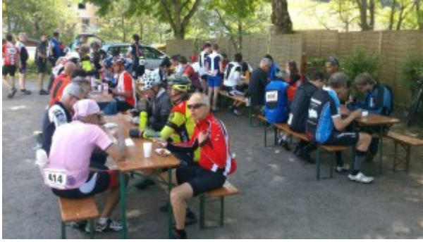
Starckenburg-RTF Mittagsrast in Mossautal **

Durch Höchst ging es zum Mümlingtalradweg, dem wir gute 10 km folgten. Der Weg ist landschaftlich teilweise wunderschön, für eine große Gruppe allerdings reichlich eng und bei Gegenverkehr auch nicht ungefährlich. Einige harmlose Spontan-Abstiege vom Rad verliefen aber ohne weitere Folgen. Bei Zell verließen wir den Radweg und begannen den nächsten Anstieg, der uns am Ende nach Mossautal führte. Die gewohnte „Raststätte“, das Restaurant der Schmucker Brauerei war leider geschlossen, aber wir haben gleich um die Ecke Asyl für unsere Mittagsrast bei km 67 gefunden. Mehr als die Hälfte der Strecke lag schon hinter uns und mit Nudelsalat, Tomaten, Gürkchen, Fleischwurst und natürlich Streuselkuchen wurde eine ausreichende Grundlage für die Weiterfahrt gelegt. Nach der Mittagspause gab es noch die Gelegenheit in die langsamere Gruppe 119/24 zu wechseln (oder auch umgekehrt).