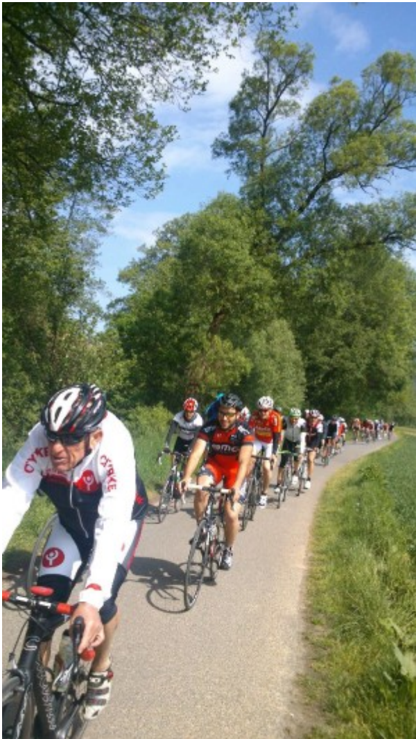
Starckenburg-RTF: Mümlingtal-Radweg **

Auf der folgenden Abfahrt wurde diszipliniert gefahren und nach einem weiteren kleinen Anstieg und der entsprechenden Abfahrt hatten wir kurz hinter Hainstadt bei km 41 unsere erste Verpflegungsstelle erreicht. Ausreichend Getränke, lecker Streuselkuchen, das war doch ein nettes zweites Frühstück.