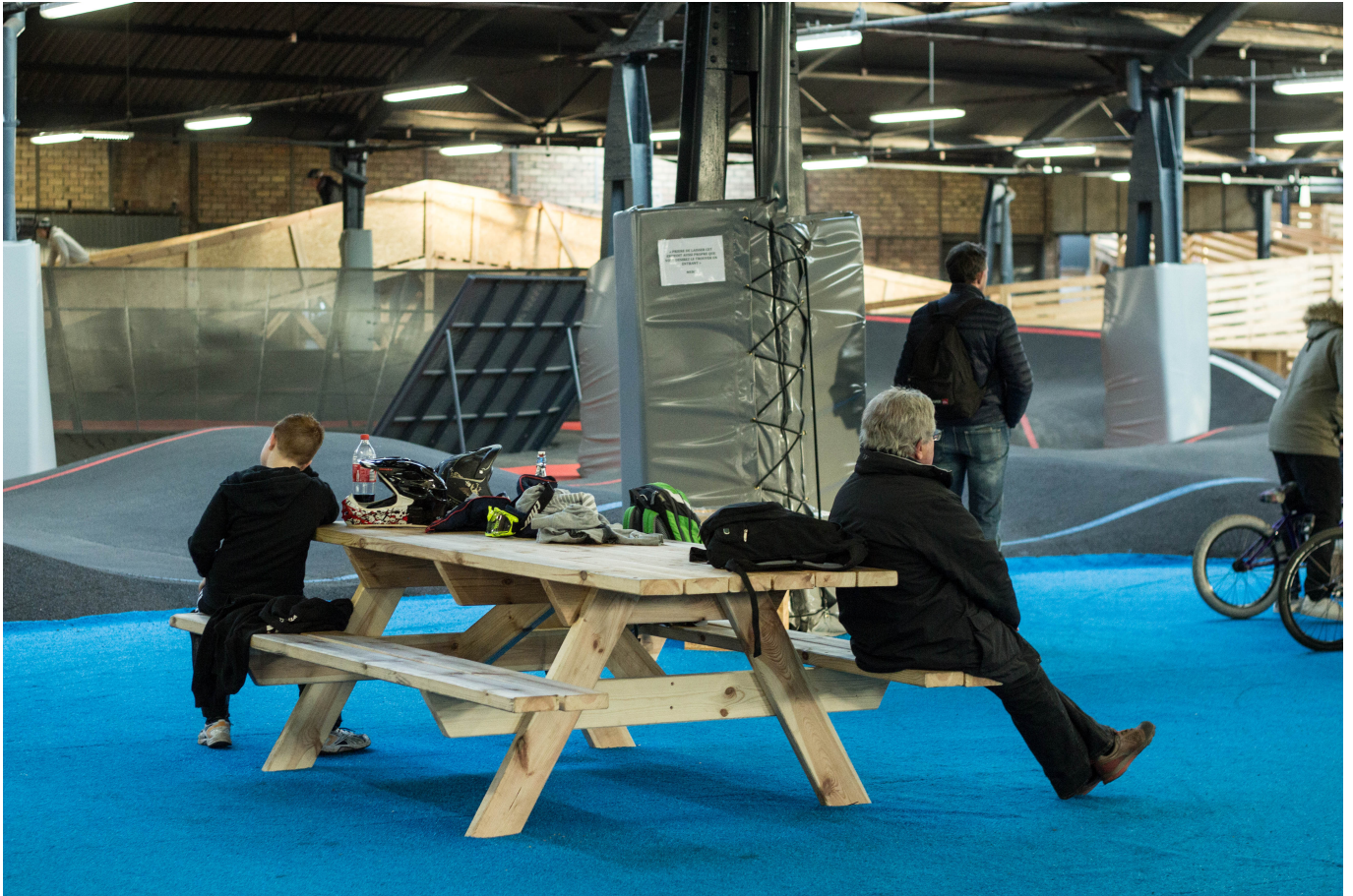
Mehrere solcher Tischen stehen im „Infield“ der Pumptrack...