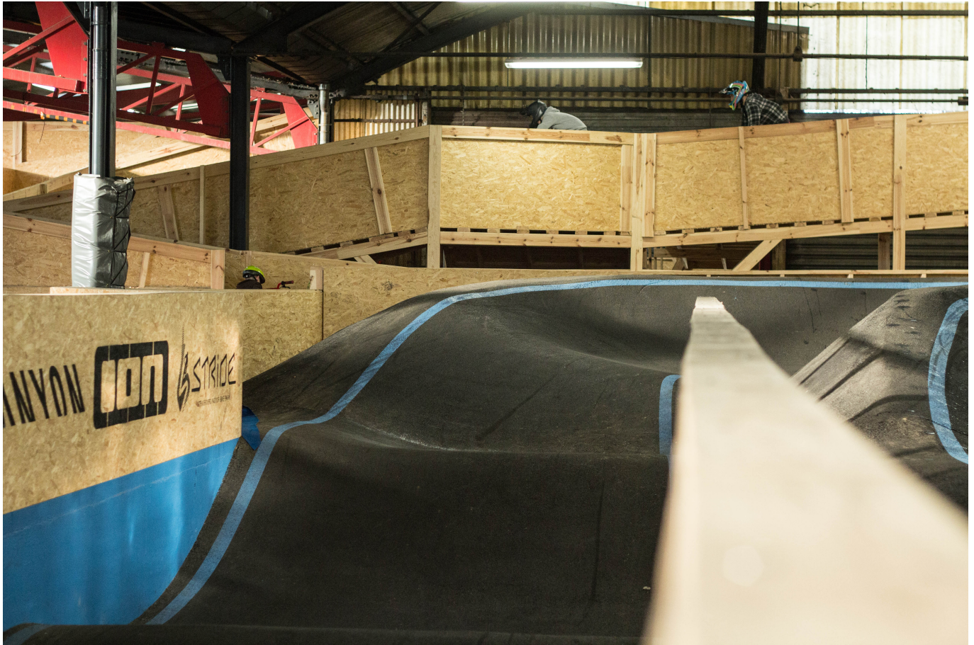
Ein Traum – 500 Meter lange Pumtrack