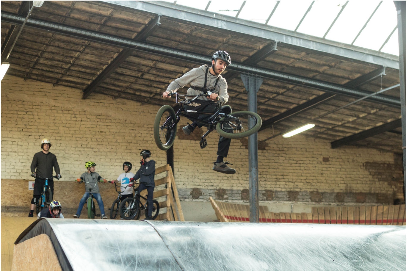
Perfekt zum Üben - Weiche Landung und genügend Sturzzone