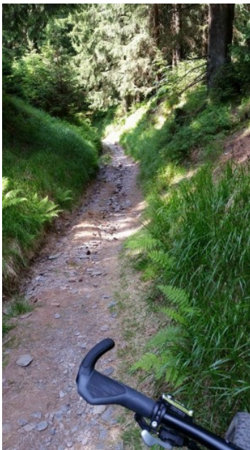
In Svens Brust schlägt das Herz eines Mountainbikers, so kommen die vielen Trails des Rennsteiges gerade recht