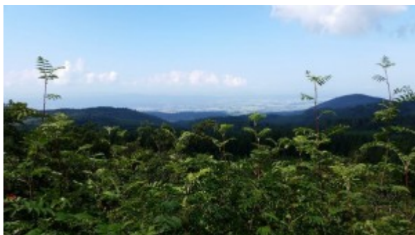
...die Aussichten über das Land machen die vielen Höhenmeter etwas erträglicher.