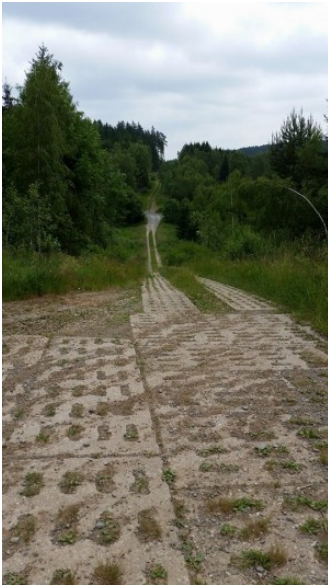
Die berühmten Lochplatten rütteln zwar ordentlich durch aber Sven kommt gut voran.