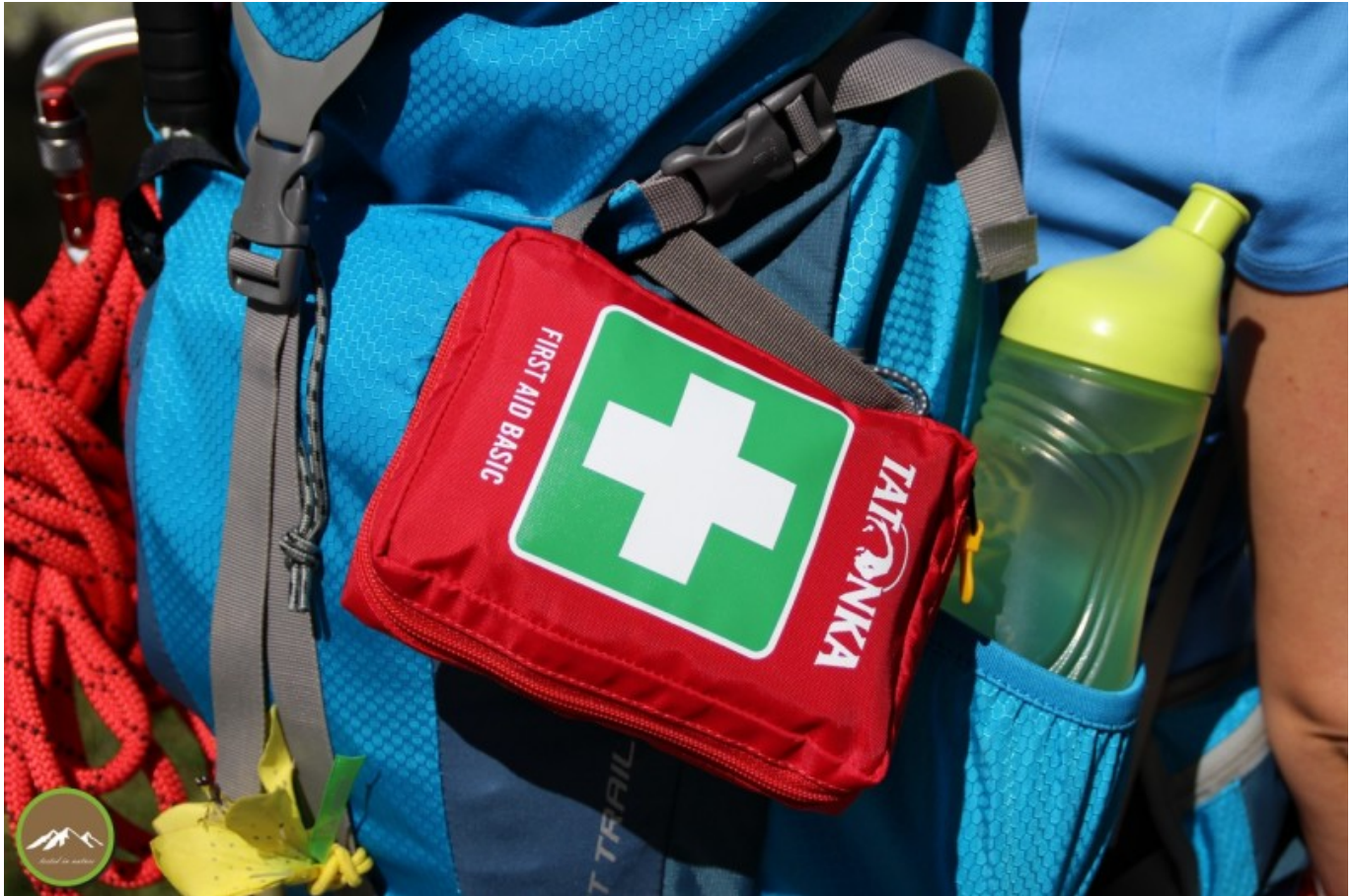
Anbringung am Rucksack außen

Wirklich toll aufgemacht und als wichtig wurde der Spickzettel erachtet. Er ist witzig aufgemacht, so dass man ihn tatsächlich auch mal im „Normalzustand“ in die Hand nimmt und durchliest. Auch im Notfall, wo man keine Nerven fürs Kleingedruckte hat, sind die Bilder aufschlussreich und man findet schnell die passende Passage.