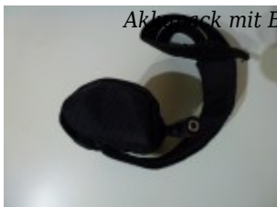
Akkupack mit Befestigungsriemen

Oftmals schaltet man ja auch zwischen den Stufen hin und her um Akkuleistung zu sparen bzw. weil man die volle Leistung nicht benötigt (z.B. innerhalb von Ortschaften)