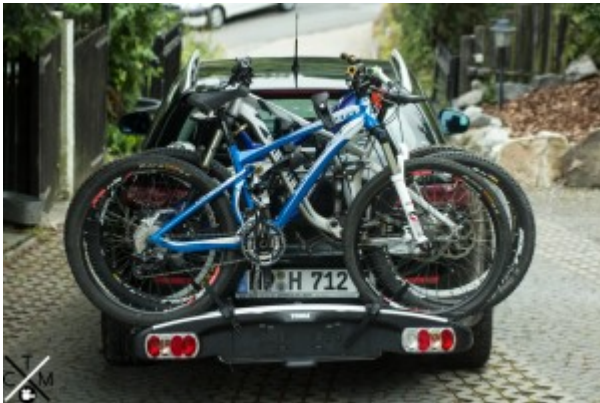
Der Thule im beladenen Zustand.

ersten Rades keine unschönen Kratzer am Auto entstehen können. Einziger Nachteil dieser Konstruktion ist das man die „Haltearme“ für die weiteren Bikes durch den Rahmen des ersten durchfädeln muss, dies kann je nach Rad etwas kompliziert bzw aufwendig werden. Sitzt jedoch das erste Rad auf der Schiene und es sind die Haltearme hindurch gefädelt wird das Bike am Rahmen mit der mehr als stabilen Klemme befestigt und an den Reifen mit einer Ratschenähnlichen Konstruktion gehalten. Diese System zur Befestigung erleichtert das Befestigen der Räder im Vergleich zum Eufab Luke um einiges, da man hier weder etwas einfädeln, noch sich dreckig machen muss und das Ratschensystem nur einen marginalen Kraftaufwand fordert. Wenn nun auch die anderen 2 Bikes montiert sind erhält man ein kompaktes Gesamtpaket was sich auf dem Träger selbst nur minimal bewegt und einen grundsoliden Eindruck macht. Lediglich minimale auf und ab Bewegungen lassen sich im Stand feststellen, welche aber größtenteils auf den Flex der Kupplung und minimal auf den Träger selbst zurückzuführen sind.