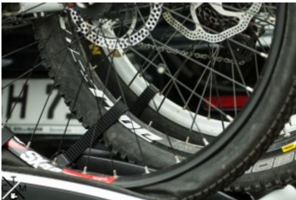
Ratschensystem zur Befestigung der Räder.