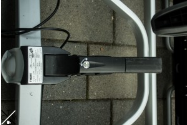
Hebel zum arretieren auf der Kupplung.

Die kompakte Bauweise und sein relativ gering gehaltenes Gewicht ermöglichen eine angenehme Montage welche von einer einzelnen Person binnen 1er Minute durchgeführt werden kann. Vor der Montage wird der schwarze Bügel nach oben hin geöffnet und sobald das „Maul“ auf der Kupplung sitzt nach unten geschlossen. Nun kann man über eine von Hand zu bedienende Stellschraube die Klemmung an die eigene Kupplung anpassen. Alles in allem kann man zur Montage sagen das sie leicht und schnell von der Hand läuft und auch von einer einzelnen Person getätigt werden kann, ein klarer Pluspunkt.