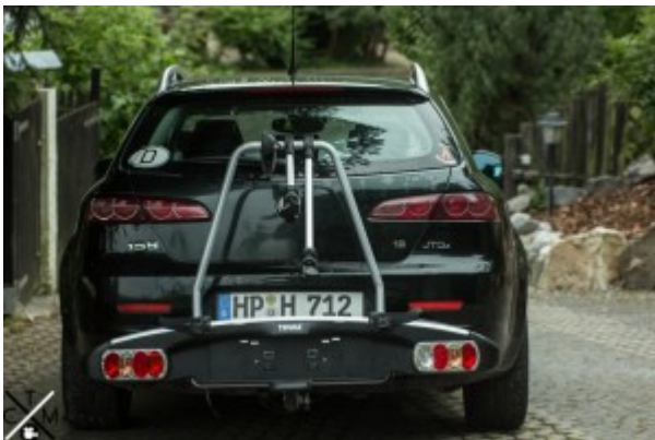
Der montierte Träger in der Heckansicht