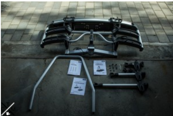
Alle Einzelteile vor der Montage des Thule

Der Träger wird relativ kompakt in einem mittelgroßen Karton geliefert und lässt sich mit wenigen Handgriffen zum Aufbau aus dem Karton entnehmen. In der beigelegten Anleitung werden alle Schritte ausführlich beschrieben und der Aufbau geht mit dem mitgelieferten Werkzeug schnell von der Hand da der Träger größtenteils vormontiert ist. (Aufbau erfolgt in ca 15-20 min)