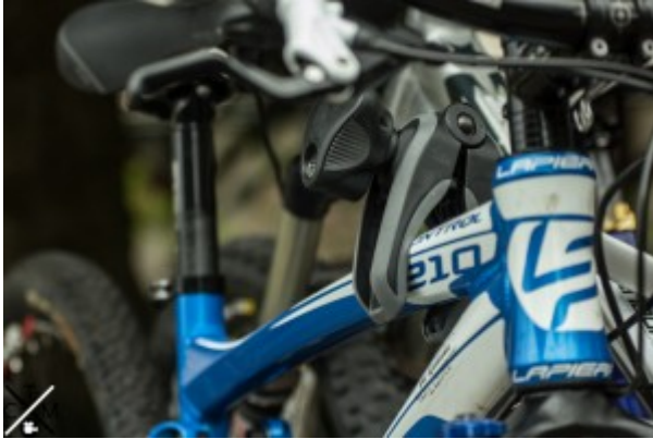
Geklemmtes 3tes Rad auf dem Thule EuroWay.