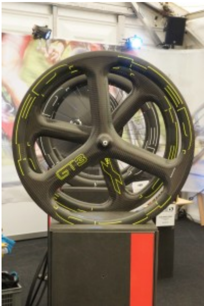
TCE 2016: HED