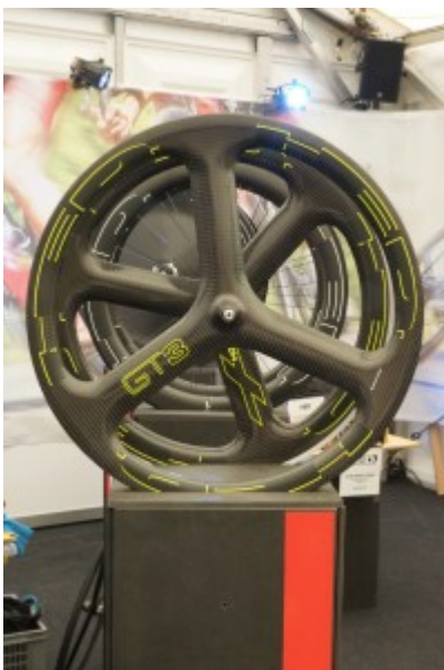
TCE 2016: HED