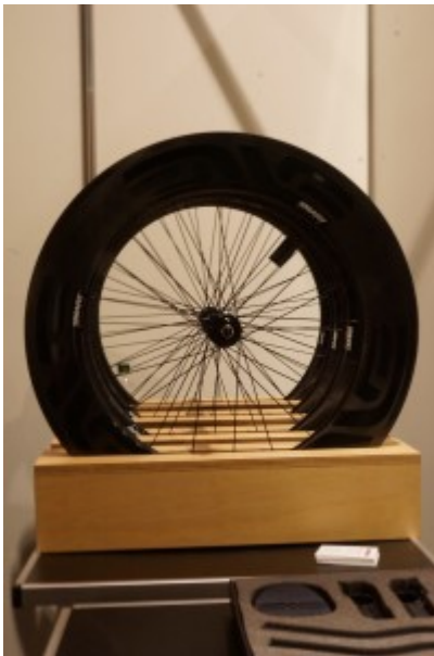
TCE 2016: Enve