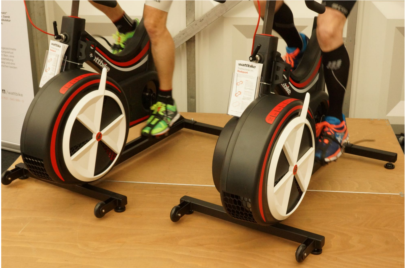
TCE 2016: Indoor-Triathlon

Vom 26.2.2016 bis 28.2.2016 fand in der neuen Stadthalle in Langen zum zweiten Mal die Triathlon Convention Europe statt. Neben einer großen Ausstellung, deren Ausstellerliste interessante Hersteller aufführte, gab es auch ein umfangreiches Veranstaltungsprogramm. Näheres findet man auf der Website des Veranstalters.