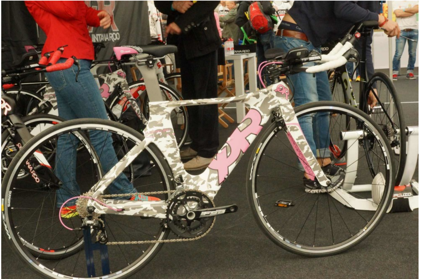
TCE 2016: QR

Neben QR haben wir z.B. auch noch BMC und Cube in der Halle gesehen.