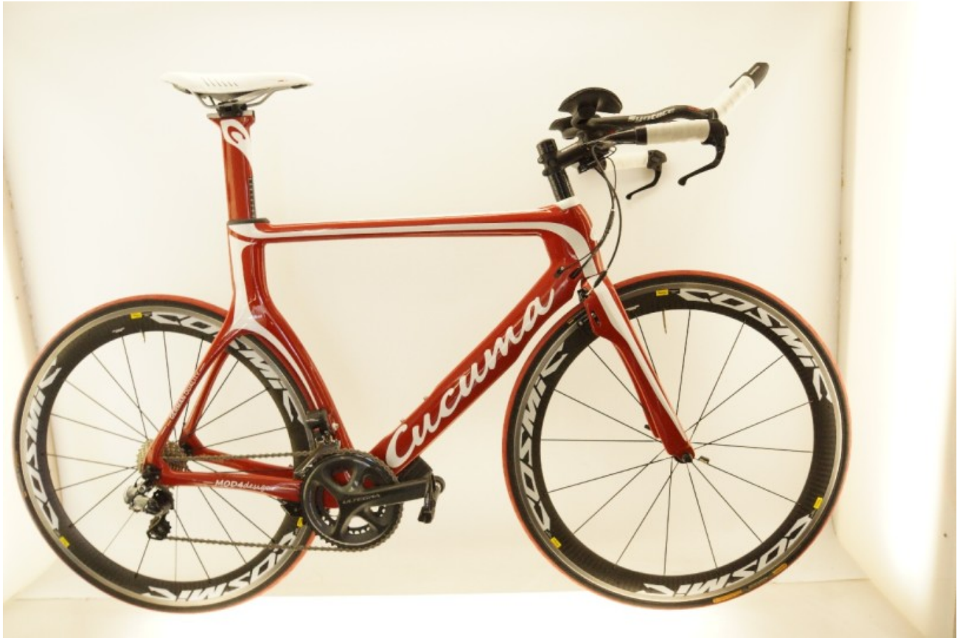
Cucuma Veloz Pro2