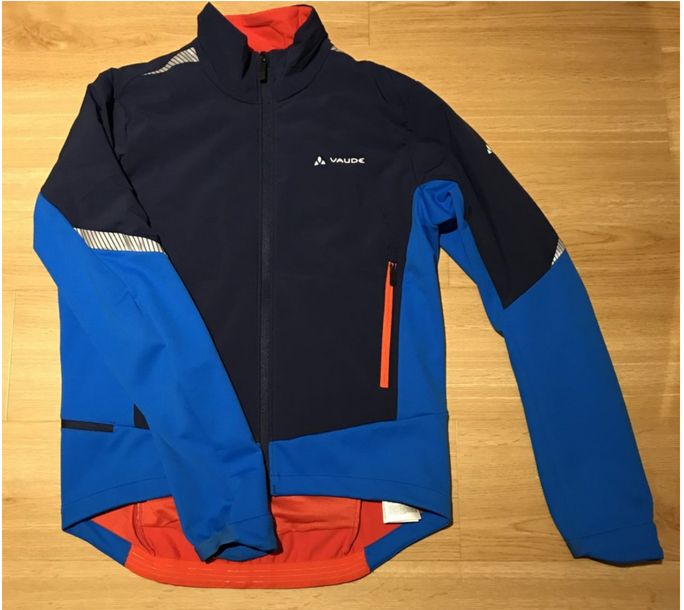
Vaude Men's Pro Insulation

Vaude bietet mit der Vaude Men's Pro Insulation Jacke eine Isolationsjacke für den Radsport, die mit Top Atmungsaktivität punkten soll. Wir haben sie für euch getestet.