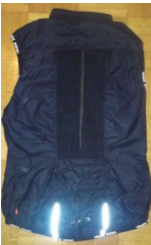
Am Rücken, unter dem Netz befindet sich eine Tasche um Riegel, etc. zu verstauen.

enhm es Gefühl . Die Weste ist sehr prakti sch für die Abfah rten, aber wenn man die Weste wiede r auszie ht, ist es unang eneh m zum fahren und man wird im schlim msten Fall krank.