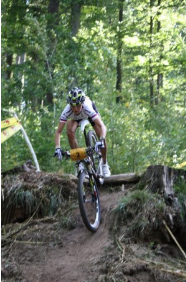
Archivbild

Gespannt sein darf man auf Straßen-Olympiasiegerin Marianne Vos, die zum ersten Mal bei einem MTB-Weltcup an den Start geht. Sie konnte schon alles auf dem Rad gewinnen aber der MTB Zirkus ist eine neue Herausforderung für sie, überspitzt formuliert scheint es so als würde es ihr mangels Konkurrenz auf der Straße langweilig geworden sein. Was die deutschen Ambitionen angeht, ruhen die Hoffnungen nicht ausschließlich auf Sabine Spitz (Haibike). Die hat schon sechsmal in Albstadt gewonnen und liebt das Publikum auf der westlichen Schwäbischen Alb. Für sie hat sich der Kurs jedoch zu ihrem Nachteil verändert. „Zwei so steile Anstiege, das kommt mir nicht so entgegen. Aber wenn man gute Form hat, dann kann man auf jeder Strecke schnell fahren“, sagt Sabine Spitz.