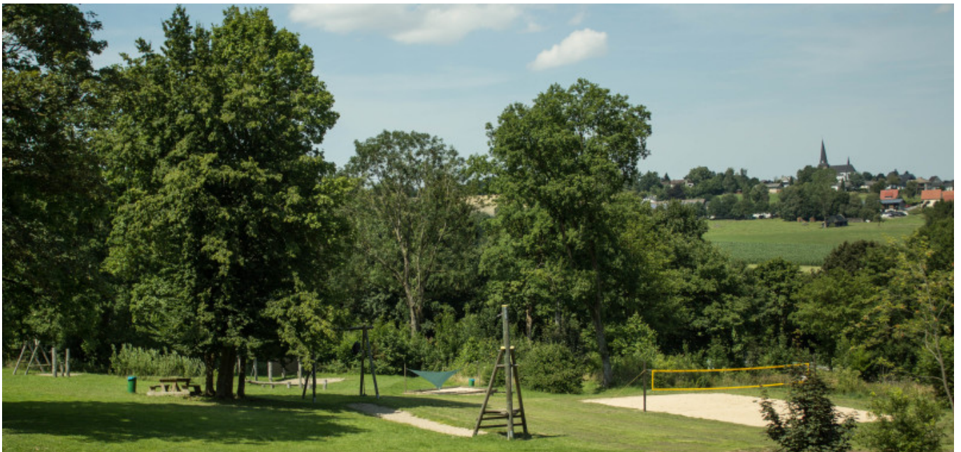
Auch Erwachsene kommen auf dem Volleyballfeld auf ihre Kosten!