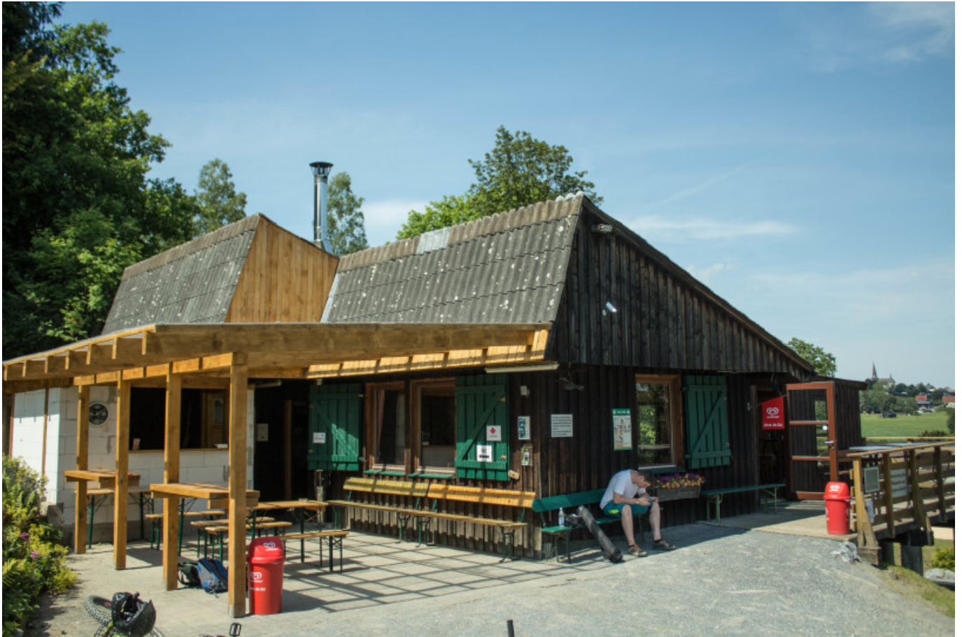
Bistro am Fuße des Berges in Kallenhardt