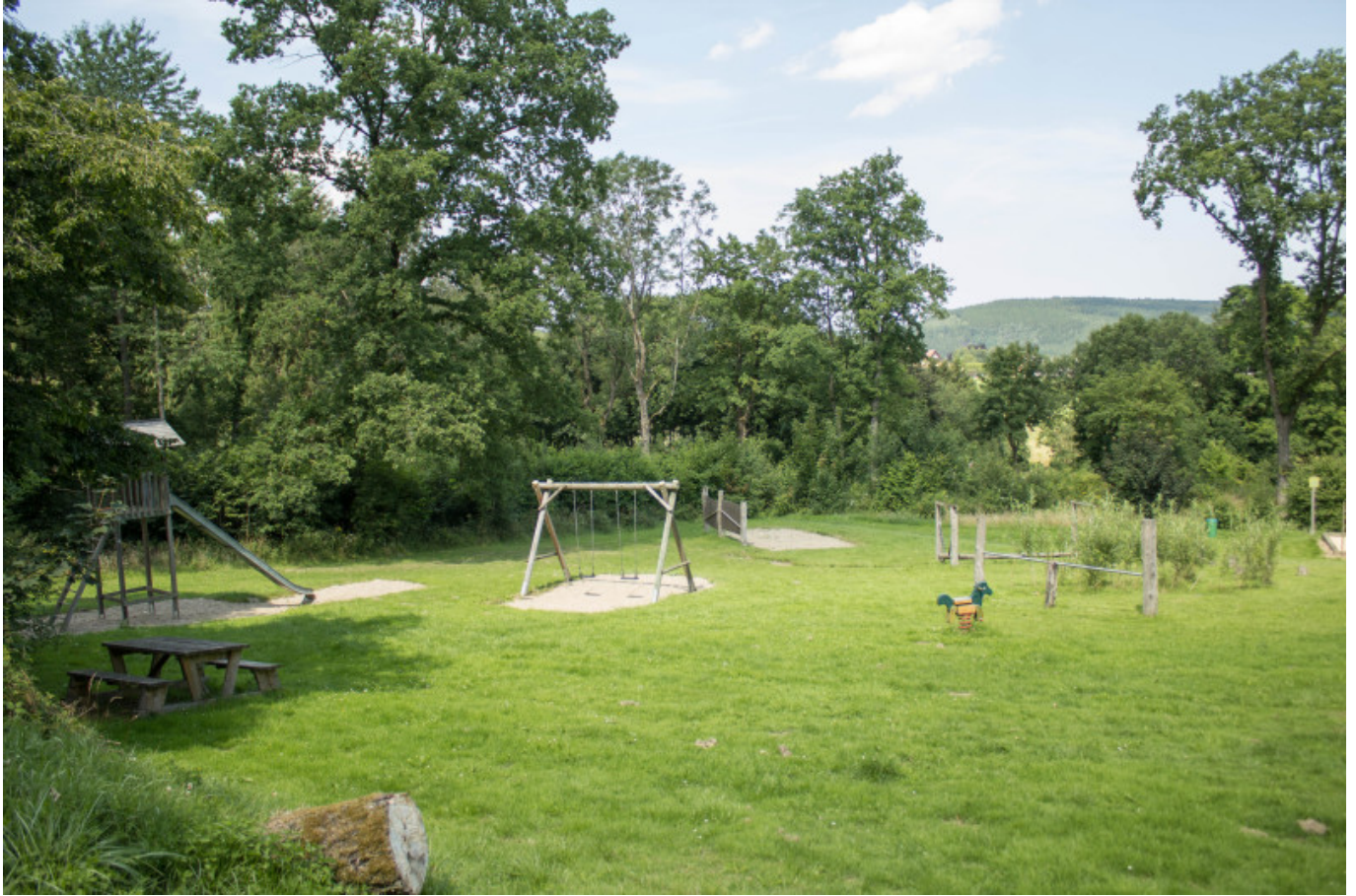
Umfangreicher und familienfreundlicher Spielplatz am Fuße des Warsteiner Bikeparks