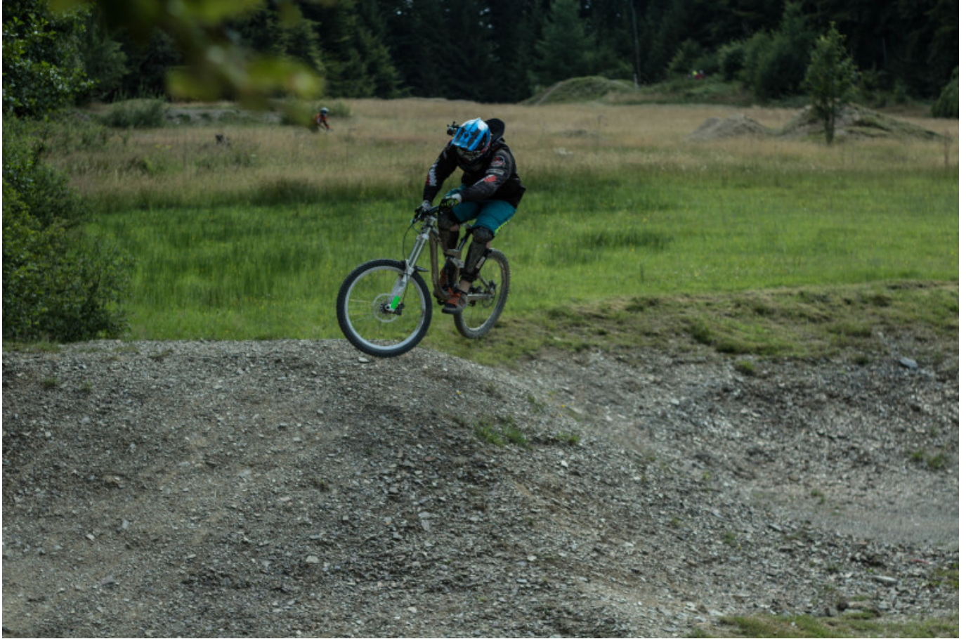
Corner Jump auf der Slopestyle.