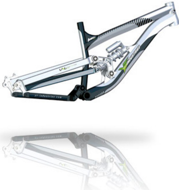
YT Tues Rahmen

Sämtliche Details zu den Bikes könnt ihr auf der Homepage nachlesen