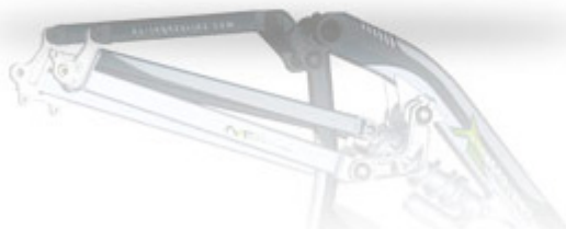
YT Tues Rahmen

Sämtliche Details zu den Bikes könnt ihr auf der Homepage nachlesen