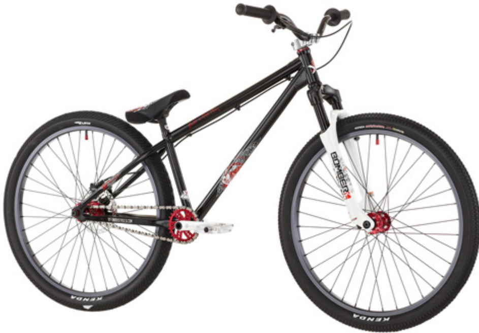
YT Dirt Love

Für die 4x-Fans schickt YT das „Romp“ ins Rennen.